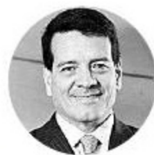
Felipe Bayón Presidente de Ecopetrol

www.larepublica.co Con el informe financiero al tercer trimestre del Grupo Ecopetrol.