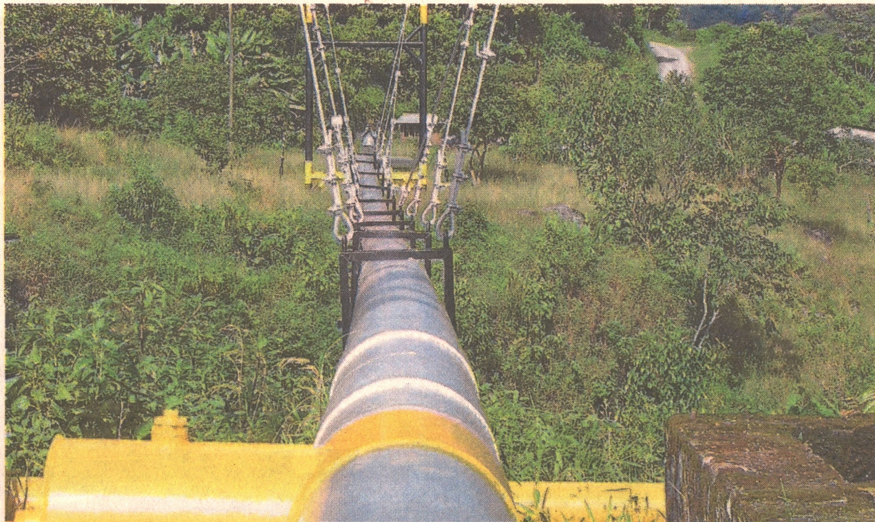
En los casi ocho meses de la crisis, el segmento de transporte ha sacado la cara en los resultados financieros de Ecopetrol.

Pero más allá de los números positivos de la opera-