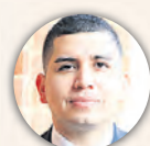
JONATHAN MALAGÓN Ministro de Vivienda

Misión para la profundización de la cartera hipotecaria: resultados y perspectivas para los colombianos.