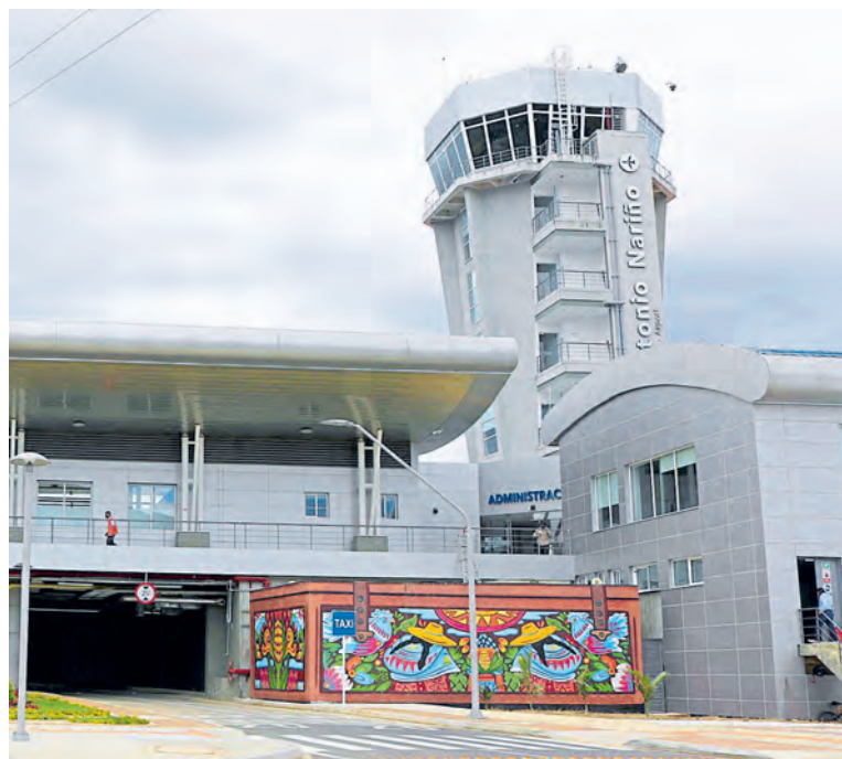
El aeropuerto Antonio Nariño (Pasto), remodelado, está en operación.

Las terminales aéreas de Leticia, Armenia y la pista sur de El Dorado serán entregadas este año. Hace una semana fue dado al servicio el aeropuerto de Pasto. Avanzan en ampliaciones y remodelaciones en 9 ciudades más. Pág. 6