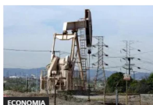
El petróleo de Texas cierra con un aumento del 2,61 %, hasta 39,57 dólares