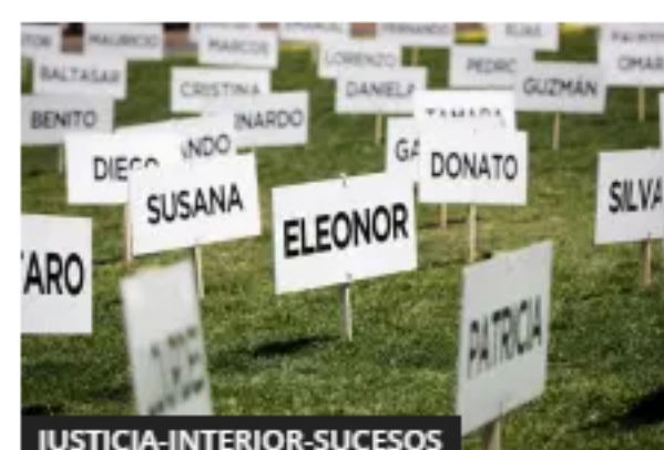
Las muertes en tránsito, una pandemia que no es ajena a Uruguay