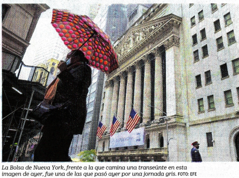
La imagen de Nueva York, frente a la que camina una transeúnte en esta foto de arte, fue una de las que pasó ayer por una jornada gris.