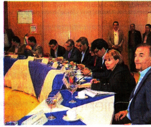
Aspecto de una de las reuniones para la concertación laboral, en diciembre del año pasado.

Tras el fuerte impacto de la pandemia del coronavirus en el bolsillo y el ingreso de miles de hogares y que, según entidades como Fedesarrollo, podría llevar la pobreza monetaria al 49 por ciento al cierre del año, las centrales obreras del país se alistan para llegar a la negociación del salario mínimo con una aspiración mayor que la de los años anteriores.