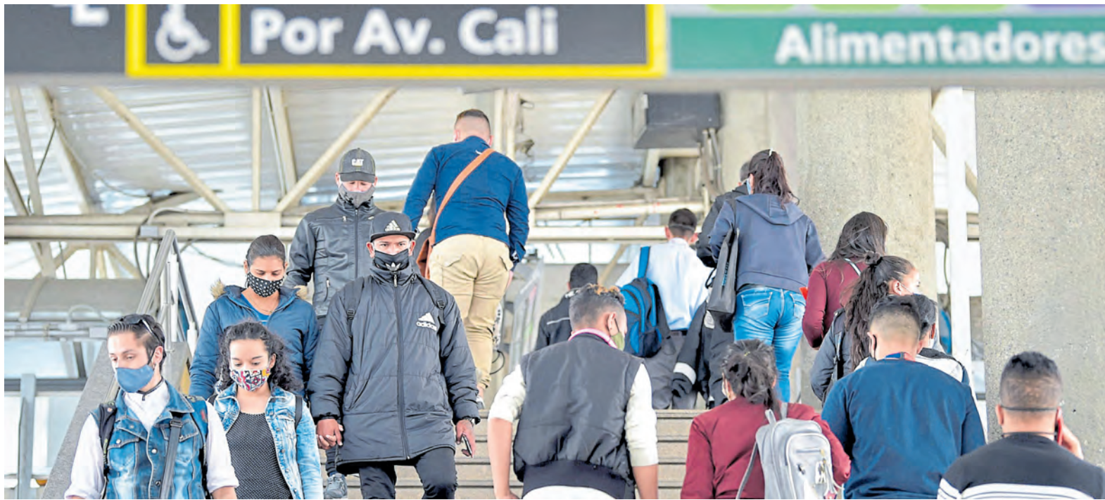
Aunque antes de la crisis la clase media estaba en una situación "más segura", la pandemia los hizo más frágiles y vulnerables.

Gobierno y expertos calculan que ese grupo se reduciría entre 4 y 8 puntos porcentuales. Esta situación haría más lenta la recuperación debido al impacto sobre el consumo. Proteger el empleo formal y a las empresas, las salidas. Pág. 8