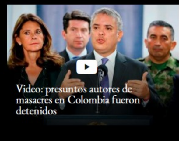
Video: presuntos autores de masacres en Colombia fueron detenidos