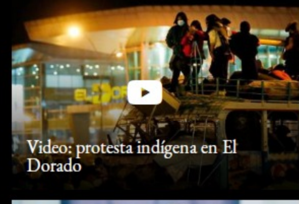
Video: protesta indígena en El Dorado