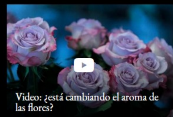
Video: ¿está cambiando el aroma de las flores?