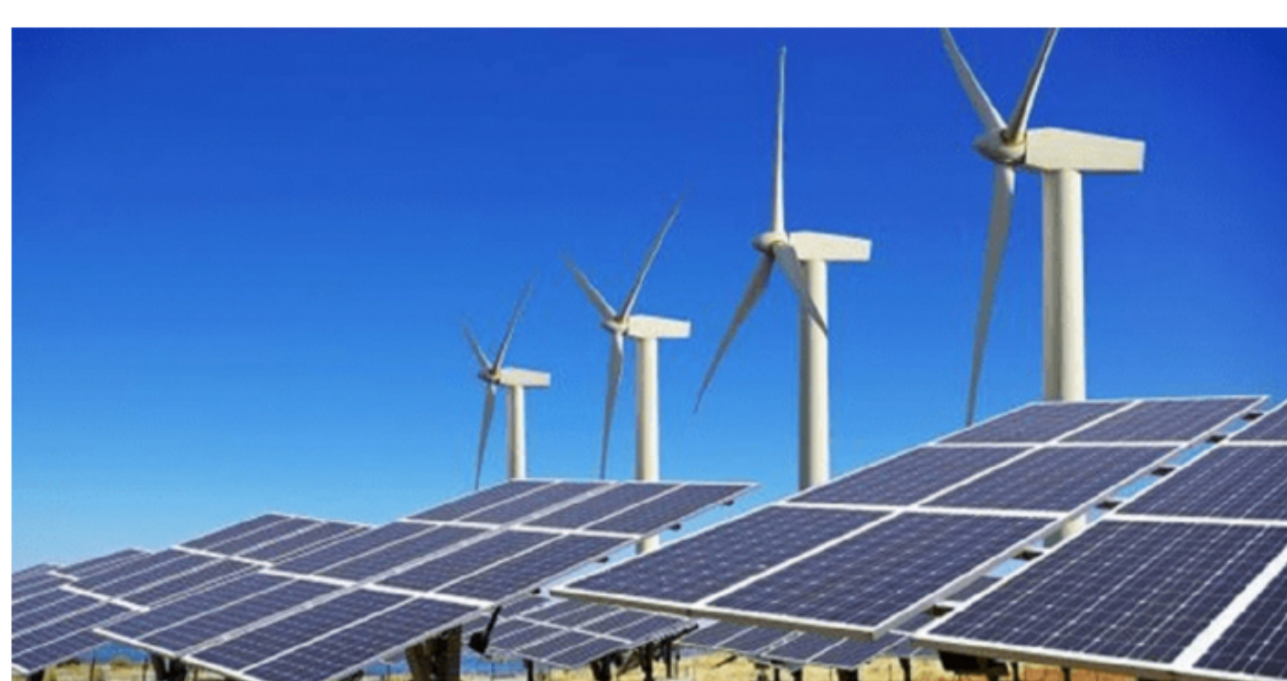
Paneles solares, energías limpias, energías renovables

El cuatro de noviembre de 2020 se llevará a cabo en Colombia la primera subasta privada para comercializar de energía eléctrica renovable, de hecho, también será la primera en América Latina.