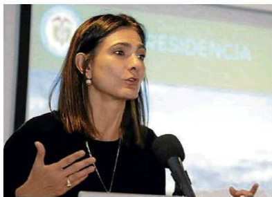
Ministerio de Transporte

La Agencia Nacional de Infraestructura (ANI) anunció que durante el primer trimestre del 2021 el Gobierno iniciará las intervenciones en el proyecto de ampliación al tercer carril doble calzada Bogotá-Girardot, en las unidades funcionales 1, que comprende los sectores entre San Rafael – El Paso y Puente Río Magdalena. La mintransporte, Ángela Orozco , resaltó que ya están las condiciones para ejecutar la obra. (AMS)