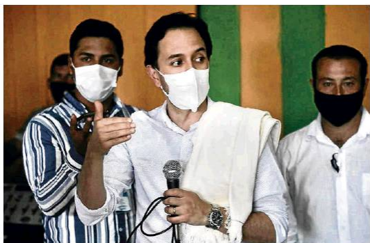
Ministerio de Minas

El Ministerio de Minas y Energía informó en su reporte del 12 al 18 de octubre que los consumos de combustibles promedio diarios reportados evidenciaron una contracción del orden de 19% en el diésel, 13% en la gasolina motor corriente, y 14% en el jet. La cartera a cargo de Diego Mesa señaló que, esto se dio como resultado de la finalización de la temporada del receso escolar. (AMS)