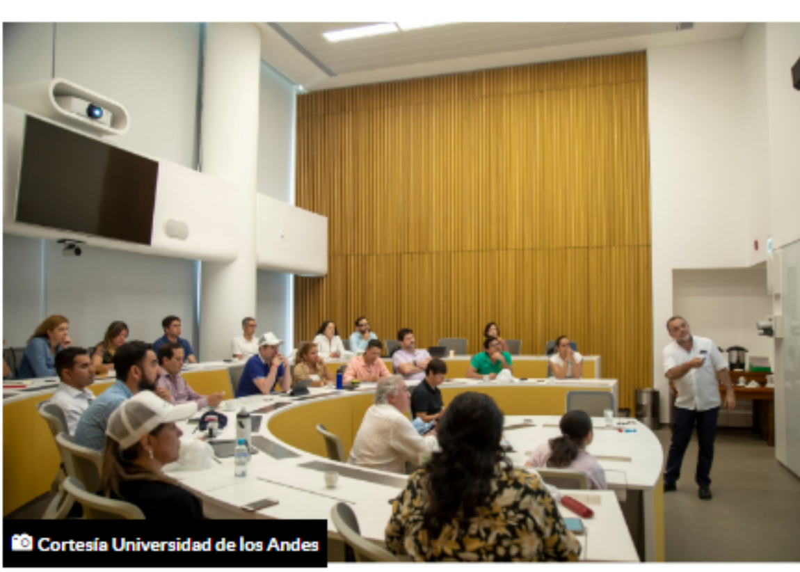
El programa Executive MBA le permitirá alcanzar nuevos objetivos en su vida profesional.

El objetivo del EMBA es formar líderes que sean capaces de ver el panorama completo y sean conscientes de la importancia de adaptar sus entornos laborales y transformarlos de forma innovadora. Es así como el programa se centra en trabajar sobre la sostenibilidad y la consciencia de un mundo con recursos limitados que está enmarcado en la evolución hacia lo digital. Ante este escenario y una nueva realidad, las organizaciones se ven obligadas a reinventarse de forma estratégica y a buscar alternativas.