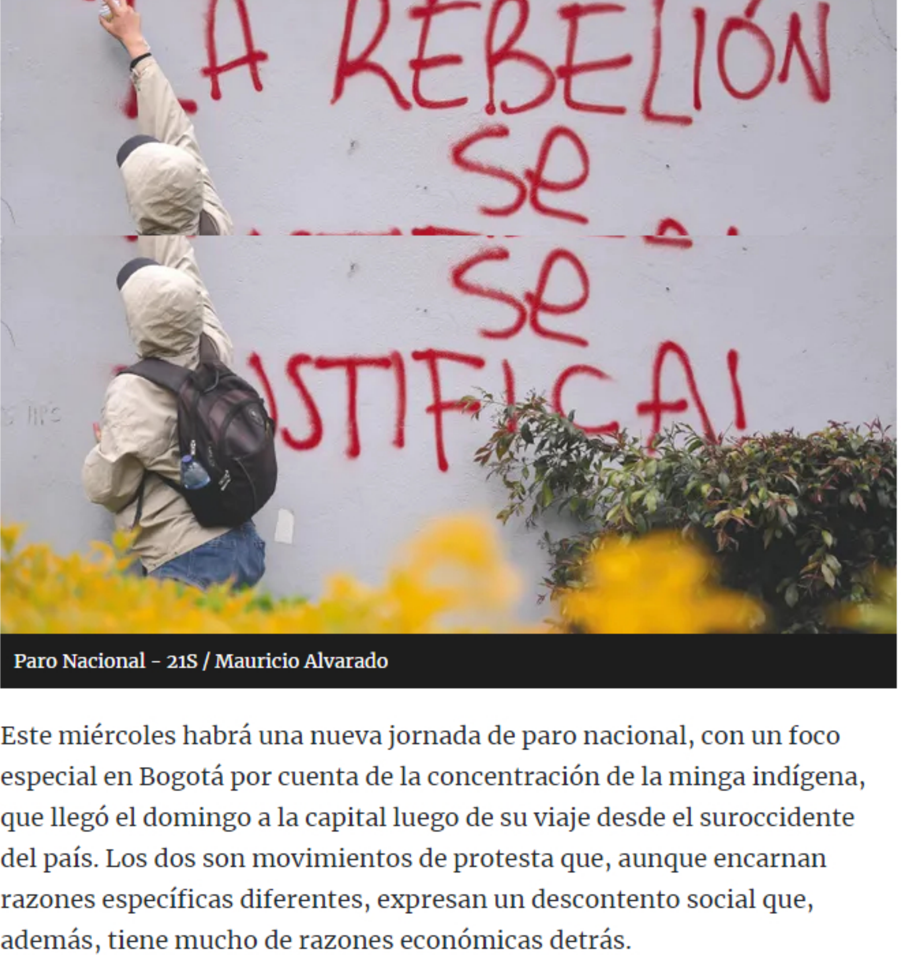
Paro Nacional - 215

Este miércoles habrá una nueva jornada de paro nacional, con un foco especial en Bogotá por cuenta de la concentración de la minga indígena, que llegó el domingo a la capital luego de su viaje desde el suroccidente del país. Los dos son movimientos de protesta que, aunque encarnan razones específicas diferentes, expresan un descontento social que, además, tiene mucho de razones económicas detrás.