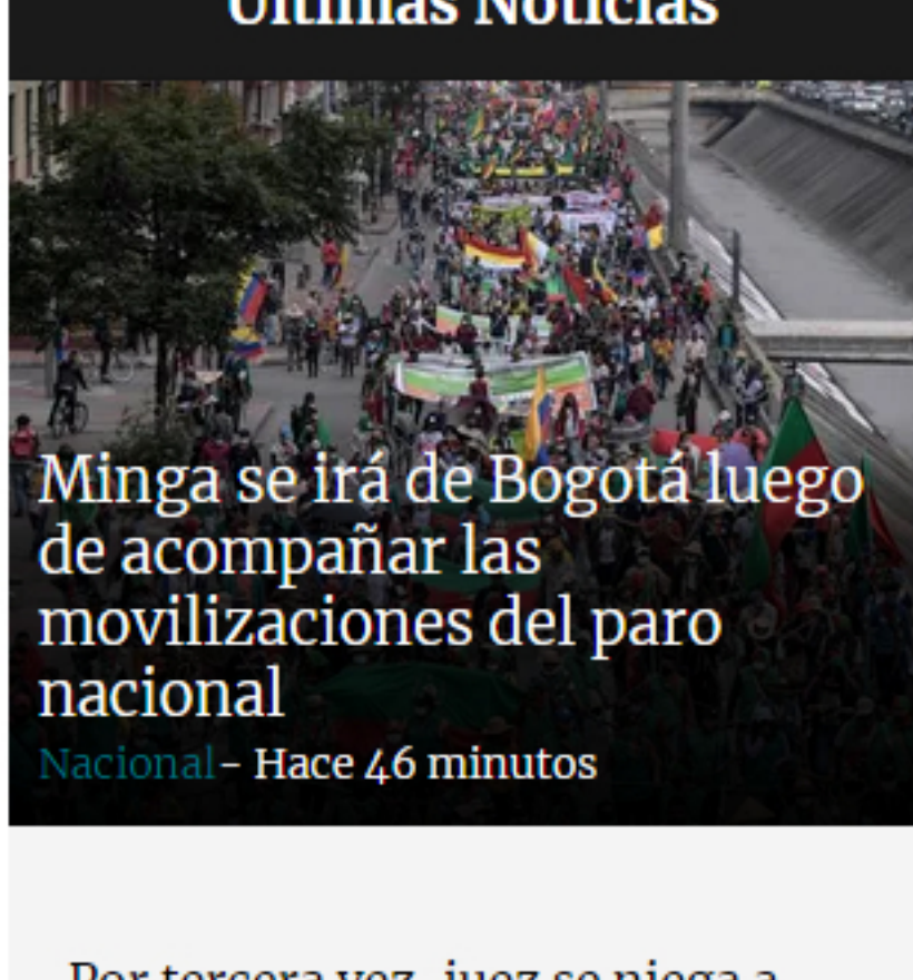
Minga se irá de Bogotá luego de acompañar las movilizaciones del paro nacional