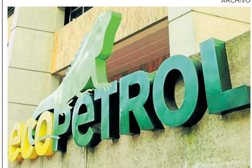
Aspecto de una refinería de Ecopetrol.

Además, Ecopetrol también apostó por el posicionamiento de los crudos producidos en Colombia en mercados nicho para diversificar los clientes de la compañía, lo que ha permitido ventas recientes de crudo a destinos como Suecia, España y Costa de Marfil. EFE