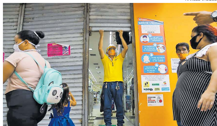
El comercio minorista fue de las actividades más afectadas durante agosto.

Para el cuarto mes del año, la economía colombiana tocó fondo al caer 20,21% para posteriormente registrar un mejor comportamiento de los indicadores, aunque se mantuvieron en terreno negativo. Durante los meses de mayo, junio y julio, la economía colombiana tuvo una contracción de 16,16%, 11,00% y 9,67%, respectivamente, motivado por factores como el regreso de algunas actividades y de las primeras dos jornadas del día sin IVA.