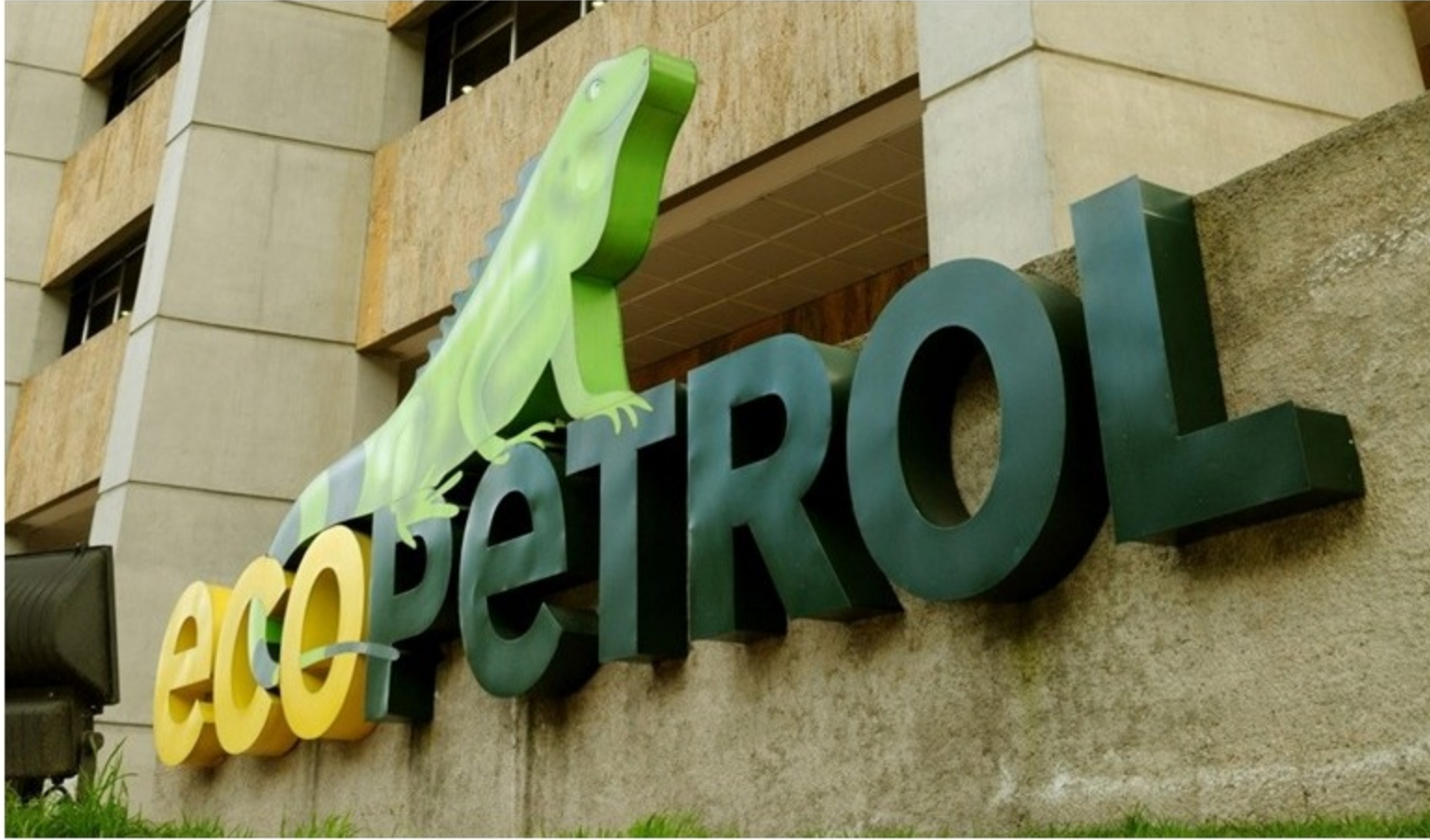
Imagen de referencia.

Tampoco se tocará Cenit , filial de transporte de hidrocarburos, oleoductos, polioductos y gasoductos.