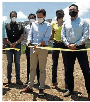
Ministerio de Minas y Energía

El ministro de Minas y Energía, Diego Mesa, asistió al evento de lanzamiento.