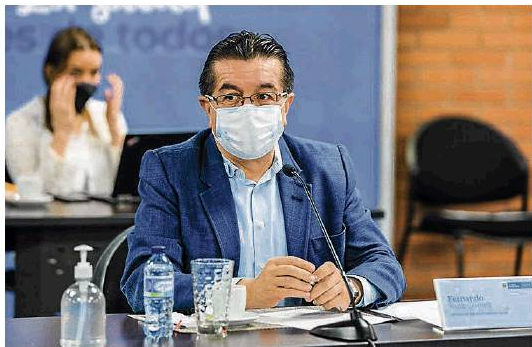
Ministerio de Salud

Mediante resolución, el ministro de Salud, Fernando Ruiz, comunicó los nuevos protocolos de bioseguridad para el funcionamiento de autocines y autoeventos en el país. Entre las medidas dispuestas se contempla la distancia entre sillas, que ahora permite la ubicación de cuatro personas seguidas. Y se reglamenta la venta y compra de alimentos y bebidas dentro de los establecimientos de entretenimiento. (JT)