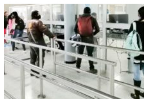
Secretaría de Movilidad no prestará servicio en sus sedes de atención al ciudadano este sábado