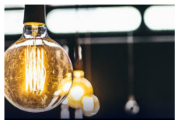
Habrá cortes de energía en Bogotá este 10 de octubre