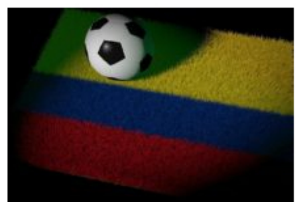
Distrito y comerciantes invitan a cumplir con los protocolos de bioseguridad