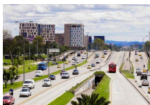
Así avanza el pico y placa en Bogotá para este 9 de octubre