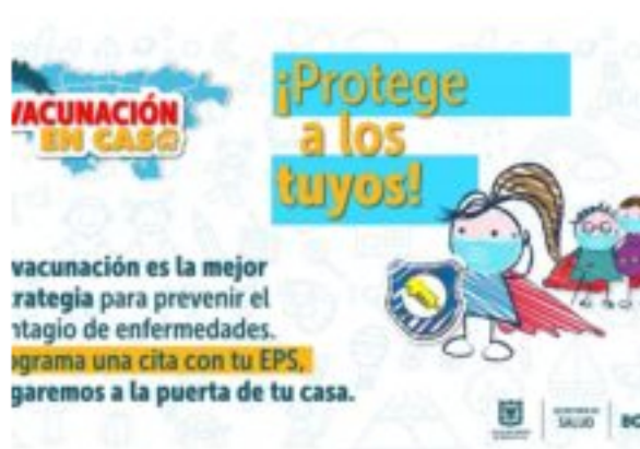
Prográmate para la jornada de "Vacunación en casa"