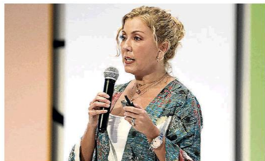
Sandra Gómez Arias, presidente de Findeter , manifestó que los recursos deberán enfocarse en capital de trabajo y proyectos de inversión.