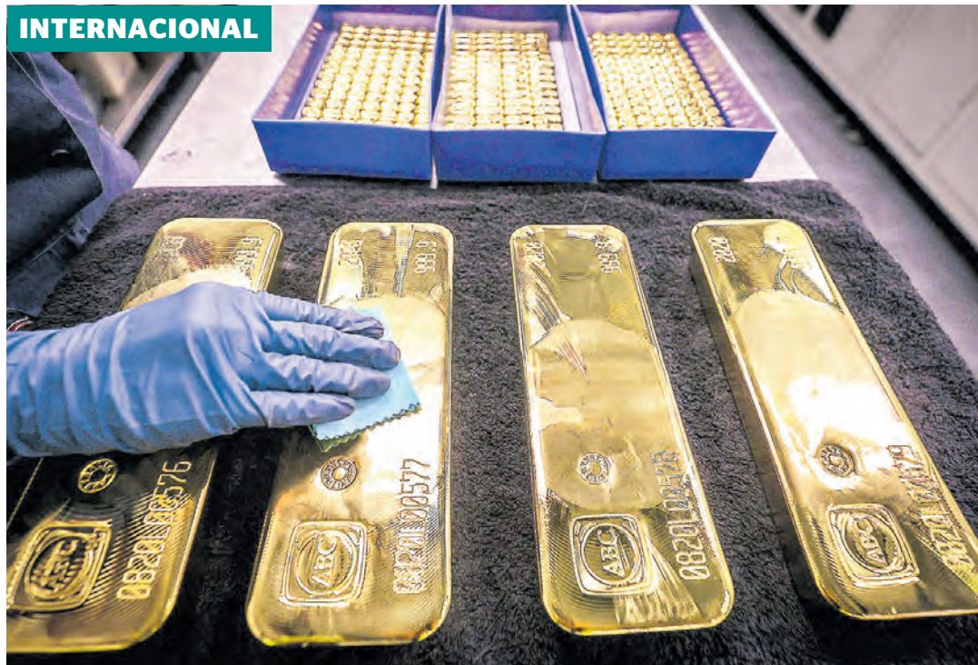
Muchos emisores han vendido oro durante la pandemia, pero en la región solo lo ha hecho Colombia.