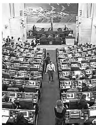
Senado de la República.

La Cámara aprobó en primer debate un proyecto para elegir 12 senadores más, que costarían casi $5.000 millones anuales. Pág. 8