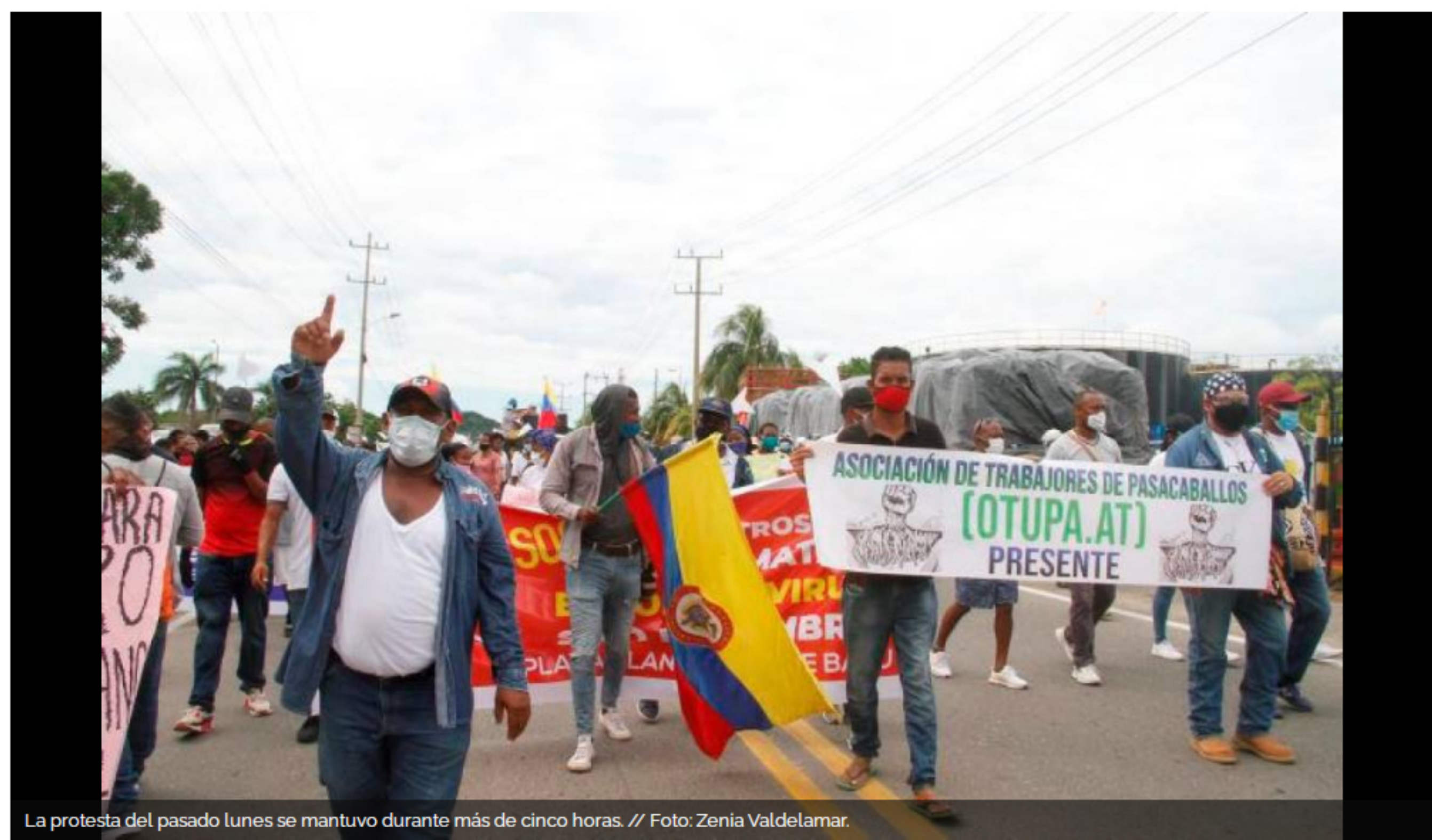
La protesta del pasado lunes se mantuvo durante más de cinco horas.

Los líderes de las comunidades seguirán protestando hasta que las empresas "cumplan sus compromisos" y vinculen más mano de obra local priorizada.