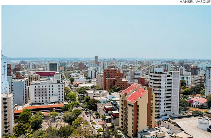
Las iniciativas están enfocadas en los sectores químicos e industrias 4.0.

Por otro lado, a la pequeña empresa se le ha entregado 1.131 créditos por valor de $115 mil millones, al tiempo que para los trabajadores independientes se han entregado 804 por $8 mil millones. RCL