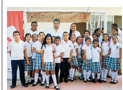
Entrega de aulas en Ca-sacará (Cesar).

En Desempeño ambiental, se recuperaron áreas de operación minera, interviniendo casi el 20% de la superficie afectada, entre otras acciones. En Desarrollo integral, la compañía destacó que tiene 5.137 empleados directos, principalmente de las zonas de influencia minera y portuaria; y 5.440 contratistas.