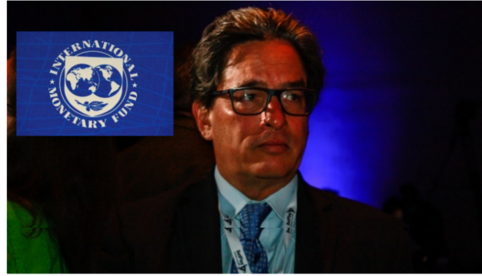
Alberto Carrasquilla, nuestra máxima autoridad económica, el más ortodoxo de los ortodoxos. hace el compromiso más ortodoxo con el FMI.

Este es un espacio de expresión libre e independiente que refleja exclusivamente los puntos de vista de los autores y no compromete el pensamiento ni la opinión de Las2Orillas.