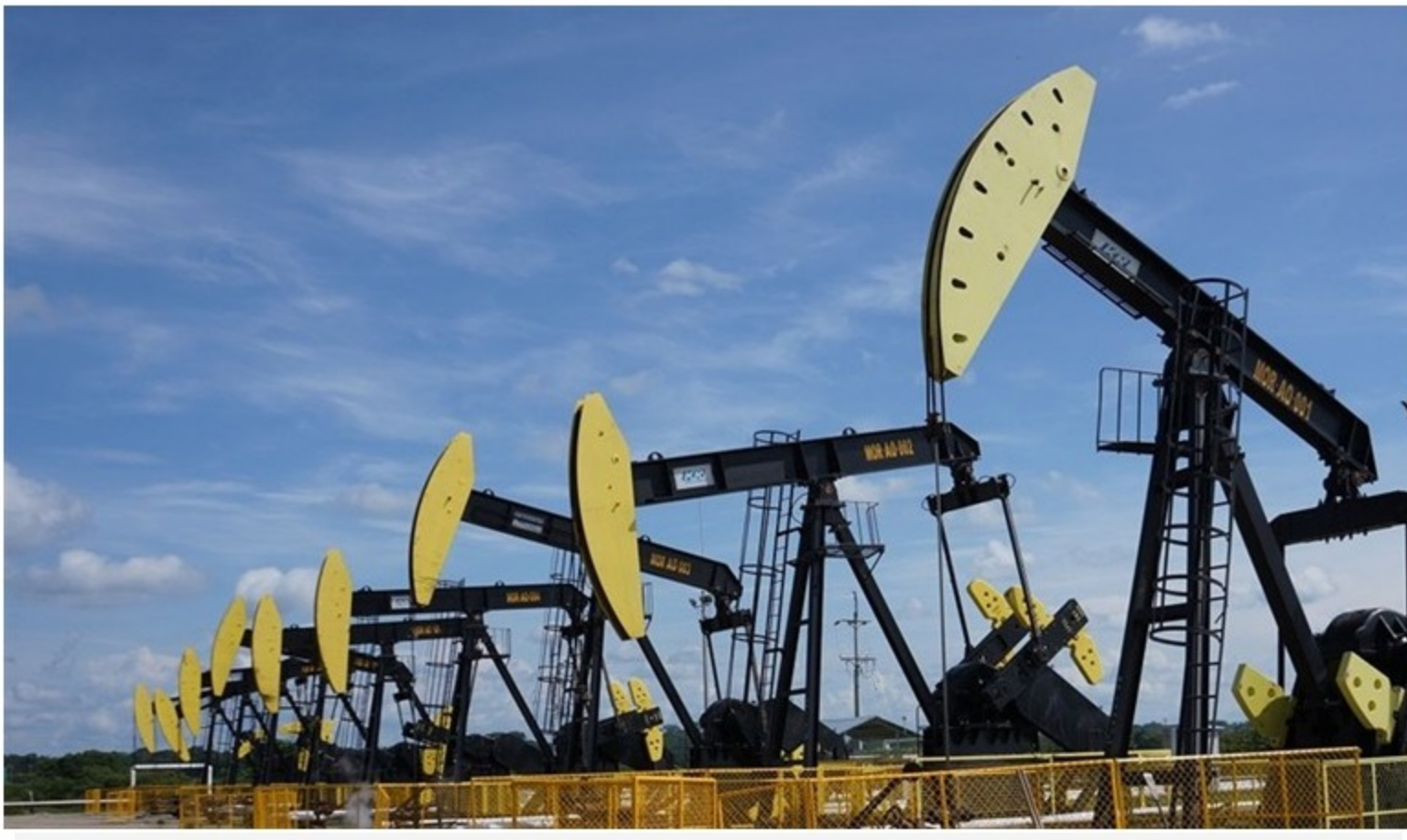
Imagen de referencia.

Sigue La W conoció el documento del Ministerio de Ambiente que estipula lo que se necesita para la exploración de hidrocarburos mediante esa modalidad.