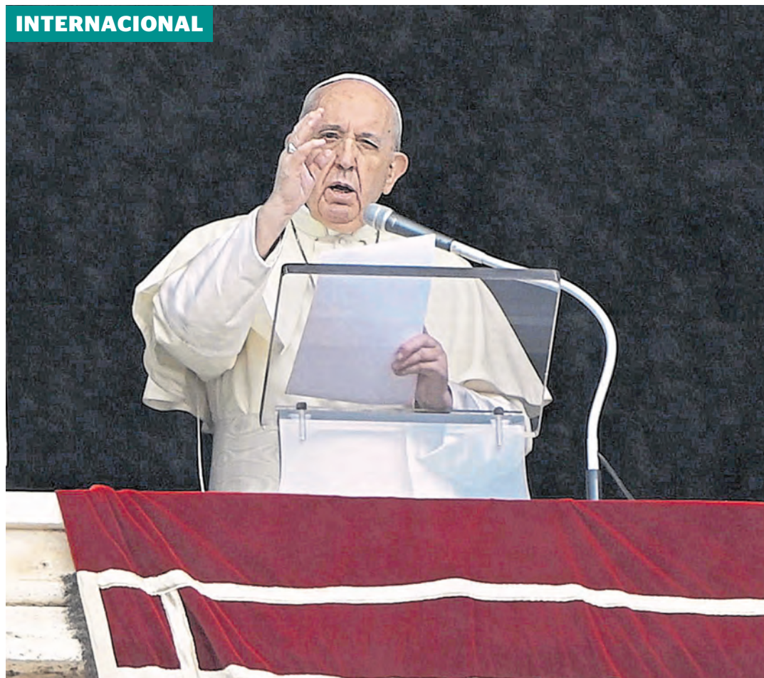
El pontífice dijo que la pandemia ha evidenciado que no todo se resuelve con la libertad de mercado.