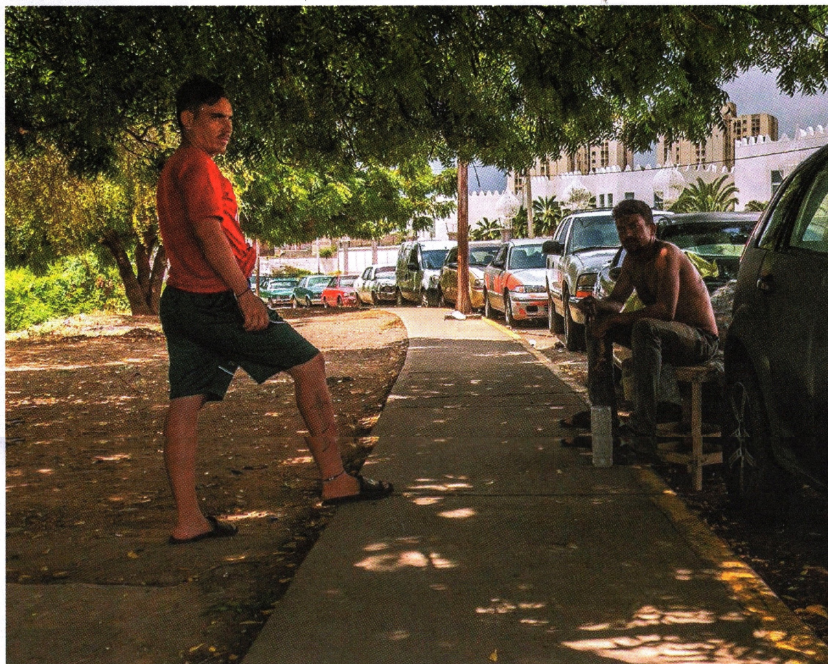
Personas hacen filas de hasta 9 horas para comprar gasolina en Venezuela.

Es una larga historia de dos décadas atrás. La industria petrolera venezolana venía en declive, principalmente la compañía estatal Petróleos de Venezuela (PDVSA), pero la huelga petrolera de 2002 aceleró todo. Entonces Hugo Chávez despidió a casi todo