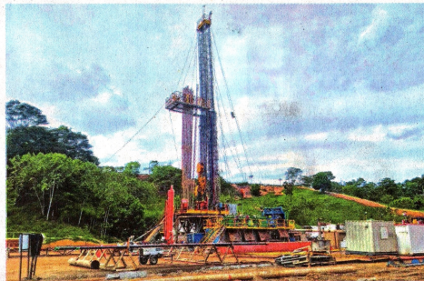
Aprovechar recursos no convencionales multiplicará los ingresos del país, al acceder a más reservas.

Fue presentado en Puerto Wilches, Santander. La ANH lo declaró elegible, para firmar contrato.