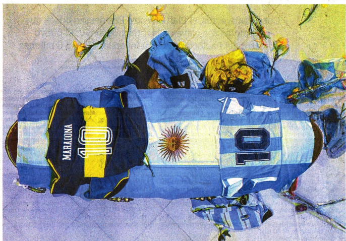
La bandera de Argentina y las camisetas de la Selección y del Boca Juniors, con el 10 icónico, cubrieron ayer el féretro de Diego Maradona durante la cámara ardiente que tuvo lugar en la Casa Rosada, sede del Gobierno argentino. Miles de personas acompañaron las horas fúnebres del astro, que se vieron empujadas por disturbios que obligaron a la intervención policial. Deportes / 1.18

La de la Procuraduría, primera condena a soldados por abuso de niña indígena. Colombia / 1.4