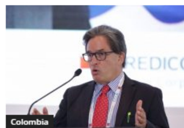
Colombia Carrasquilla reiteró necesidad de reforma tributaria en 2021