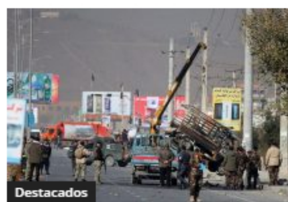
Destacados Ataque terrorista en Afganistán dejó 8 muertos y 31 heridos