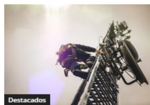
Destacados Así se están reactivando las comunicaciones en San Andrés y Providencia