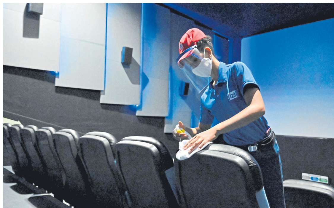
Por cuenta de la crisis, las actividades artísticas y de entretenimiento han tenido que reducir sus contratos.

Debido a la pandemia, el Dane ha venido tomando medidas especiales para la recolección de información del ICTC como visita tradicional a la fuente, llamadas, correo electrónico y página web.