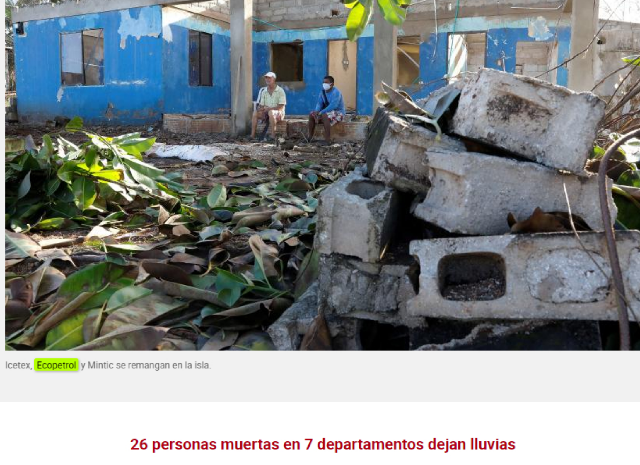
Icetex, Ecopetrol y Mintic se remangan en la isla.

Y la ministra de las TIC, Karen Abudinen, explicó que en el restablecimiento de las comunicaciones en el archipiélago se gestionó un trabajo en conjunto con los operadores Claro, Tigo, Movistar y Avantel .