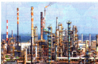
La refinera de Barrancabermeja comenzó la explotación petrolera en 1917, es la más antigua del país.

En sus hallazgos, según Rivero, encontraron que “Ecopetrol no actualizó el plan de contingencia en el 2019, como lo exigía la Autoridad Nacional de Licencias Ambientales (Anla). Su última actualización fue en el 2015”, le dijo a EL TIEMPO. Al respecto, agrega Rivero, “Ecopetrol le envió información incompleta a la Anla, sin que esta entidad le exigiera nada. Esto evidencia que la Anla no revisó esa información ni adelantó ningún proceso sancionatorio por ese incumplimiento”.