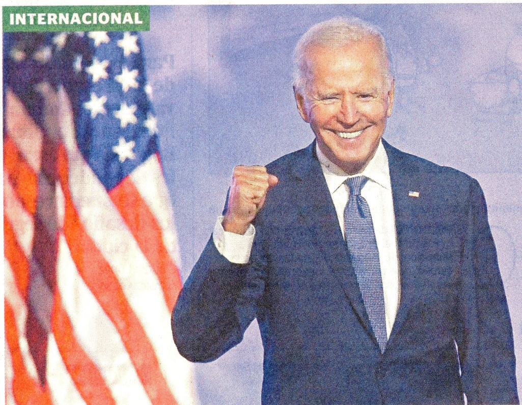
El demócrata fue declarado vencedor el sábado, tras su victoria en Pensilvania y Nevada.