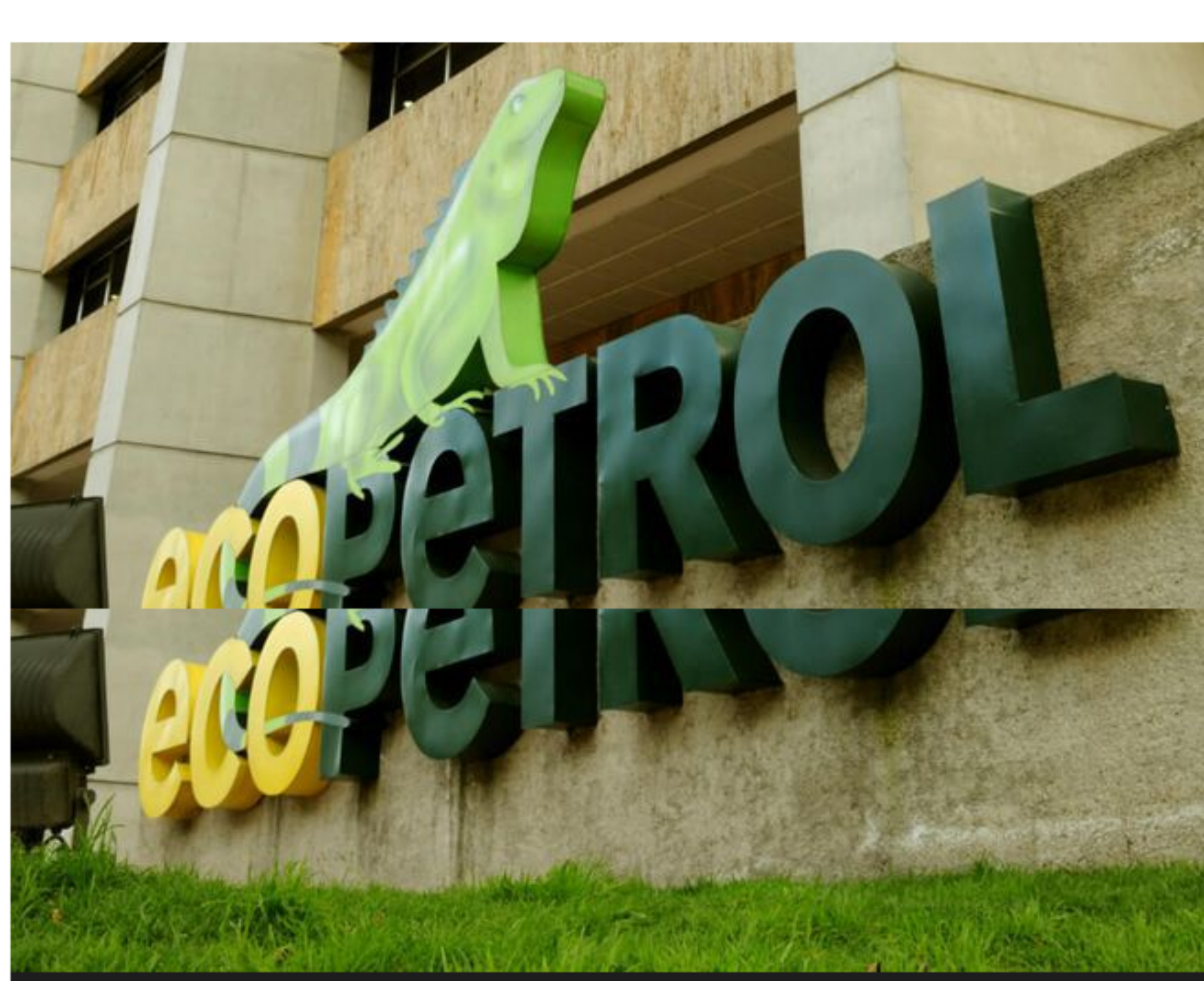
En la actualidad el Estado tiene participación accionaria en 105 empresas.

Desde hace años, Colombia viene trabajando en el fortalecimiento de la gobernanza de las empresas en las cuales el Estado tiene participación accionaria, buscando que las compañías sean más competitivas y transparentes, dijo el ministro de Hacienda, Alberto Carrasquilla, en el foro “el Valor del Buen Gobierno Corporativo en Empresas con Capital Público”, organizado por el Banco Interamericano de Desarrollo (BID), BID Invest y la Organización de Cooperación y Desarrollo Económico (OCDE).