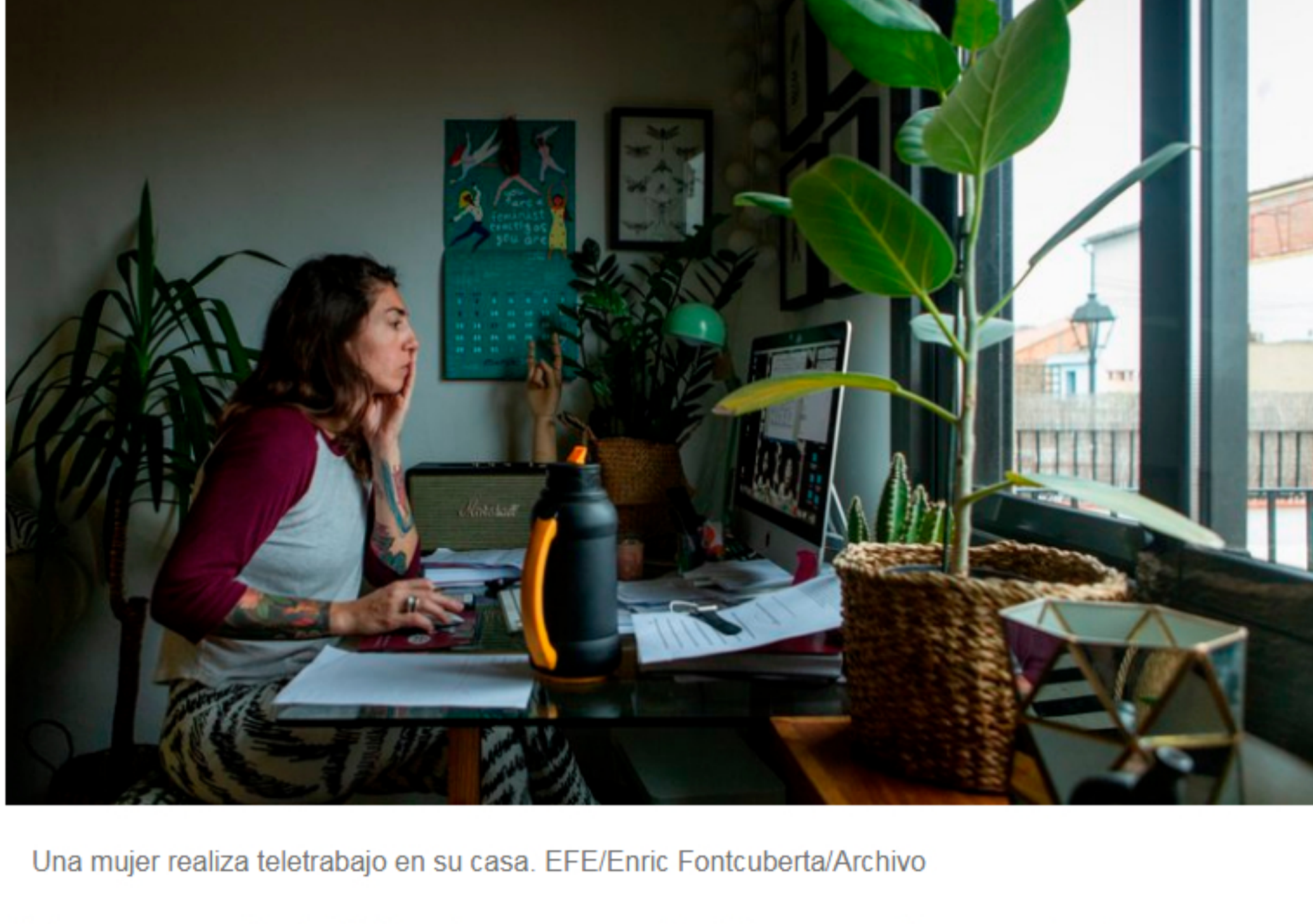
Una mujer realiza teletrabajo en su casa.

En lo que va corrido de 2020, más empresas colombianas se están sumando a la implementación del teletrabajo de forma indefinida. Las empresas como Rappi Colombia y Bancolombia ya se encuentran haciendo planes para implementar esta iniciativa que ha crecido en los últimos meses a causa del coronavirus. Entre las razones para seguir con el trabajo remoto están la comodidad del empleado y una oportunidad para empoderar más a sus trabajadores.