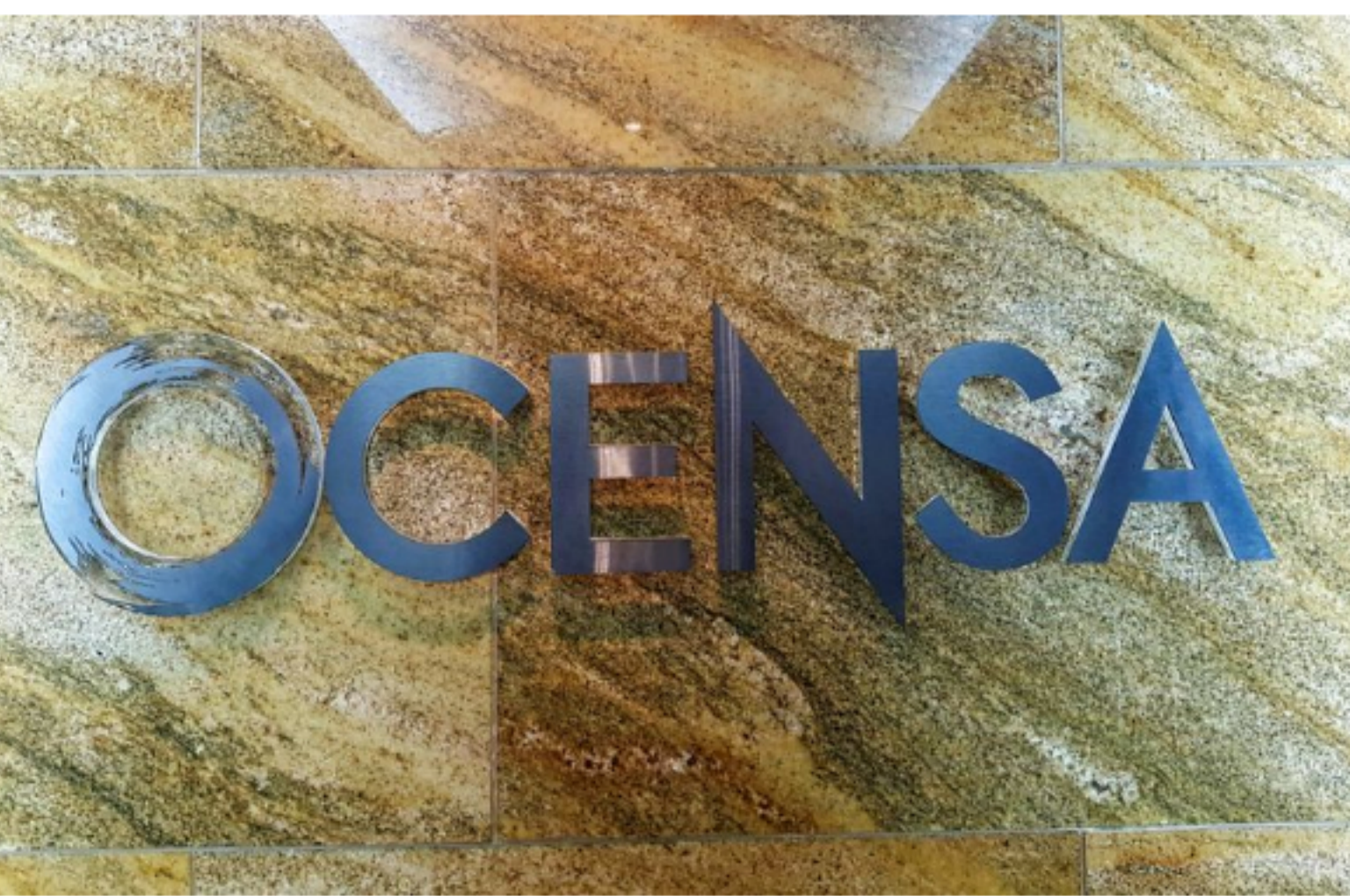
Foto de archivo. El logo de Oleoducto Central (OCENSA) en su sede en Bogotá

BOGOTÁ (Reuters) - Cenit , filial de la petrolera colombiana Ecopetrol , anunció el viernes que acordó con los productores extender hasta por seis meses el financiamiento de las tarifas de transporte de crudo por tres de sus oleoductos para mitigar el impacto de la crisis por la caída de los precios y la pandemia del coronavirus.