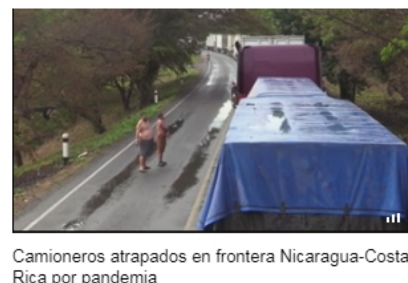
Camioneros atrapados en frontera Nicaragua-Costa Rica por pandemia