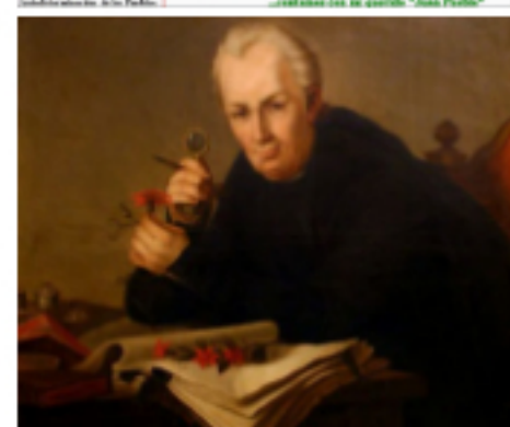
Jardín Botánico Publicado: Miércoles, 17 Agosto 2011 21:00