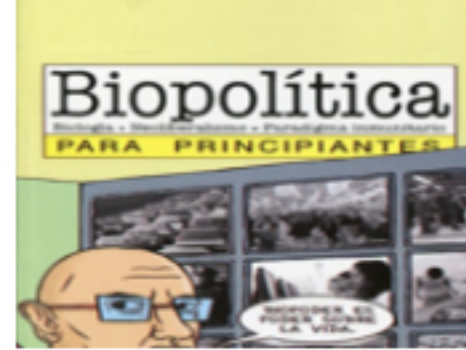
BIOPOLÍTICA (IParte) Publicado: Martes, 14 Abril 2020 21:10