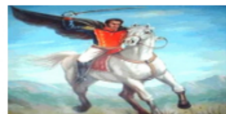
Frases Célebres del Libertador Simón Bolívar Publicado: Domingo, 23 Octubre 2011 20:22