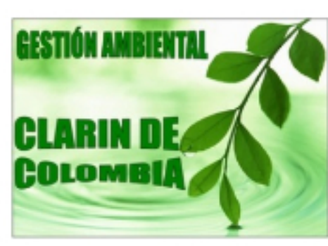
Historia de los Humedales Publicado: Martes, 13 Diciembre 2011 18:53