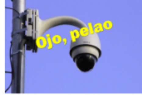
Biopolítica digital - Distopia (II Parte) Publicado: Martes, 14 Abril 2020 18:57