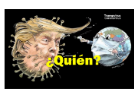
Coronavirus e imperios Publicado: Viernes, 06 Mayo 2020 02:47