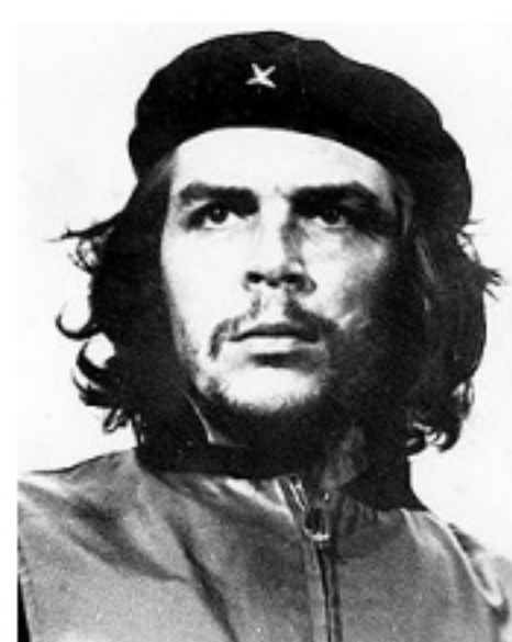
Frases Célebres de Ernesto "CHE" Guevara y Otros Publicado: Miércoles, 12 Octubre 2011 20:49