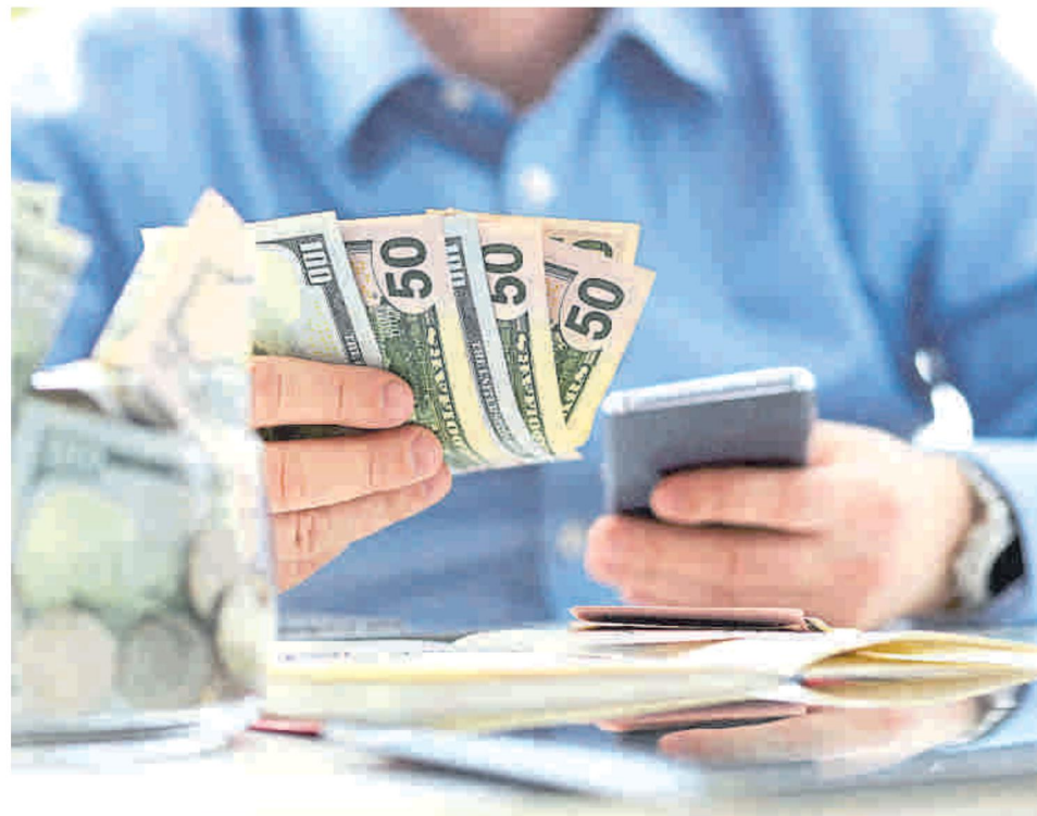
La crisis y el desempleo que deja afecta los giros de trabajadores colombianos en el exterior.

Banco Mundial dijo que las remesas registrarán una caída del 19,7 por ciento este año, aunque otras fuentes incluso han dicho que estas podrían bajar hasta 34%, como lo dijo Alejandro Reyes, economista principal de BBVA Research.