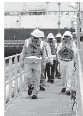
Corficolombiana destacó el resultado a marzo.

poración, María Lorena Gutiérrez, dijo que “Corficolombiana invierte en los sectores que generan desarrollo. A pesar de las dificultades, seguiremos apostando al crecimiento y la generación de empleo, por lo cual mantendremos la inversión este 2020 en $1,9 billones”.