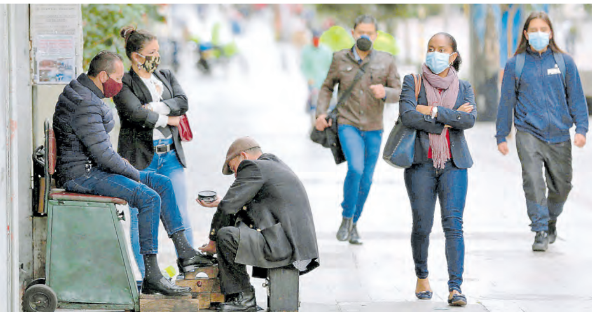
Trabajadores informales como este lustrabotas, regresaron la calle, en Bogotá, en busca de ingresos. Cesar Melgarejo.

Tras dos meses de cuarentena, la economía continúa empeorando y la caída entre abril-junio superaría el 10%. Pág. 5