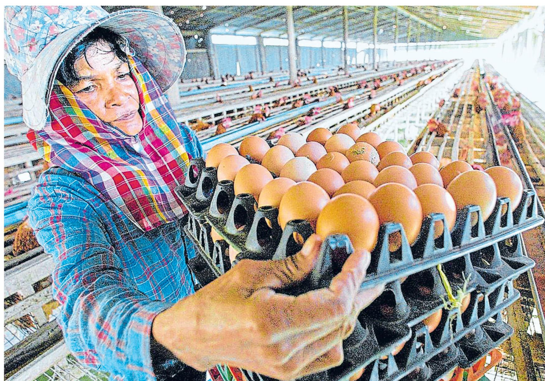
Según el Dane, el precio de los huevos se ha estabilizado, pero su valor sigue siendo alto.

En el caso de la cebolla cabeza, este producto está mostrando variaciones significativas al alza no solo en el canal mayorista sino en el minorista. El kilo se en-