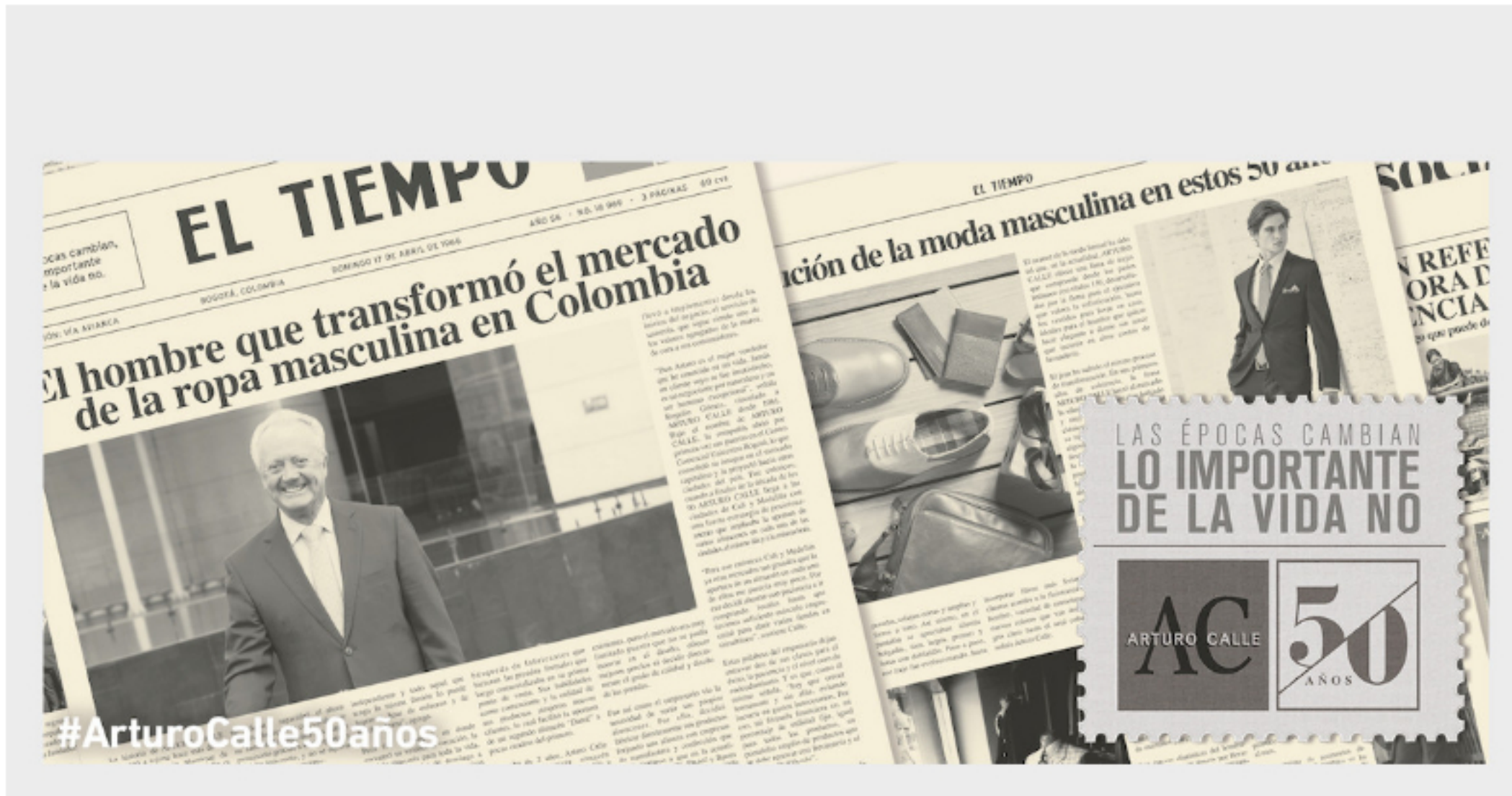
Arturo Calle presenta tres nuevas líneas de negocio - Arturo Calle

Arturo Calle retoma operaciones paulatinamente en Colombia y presenta tres novedades. El grupo textil especializado en la moda masculina apuesta por la elaboración de tapabocas adaptados a su ADN de marca, prendas básicas y cómodas con su nueva línea Real Basics, y una línea institucional.