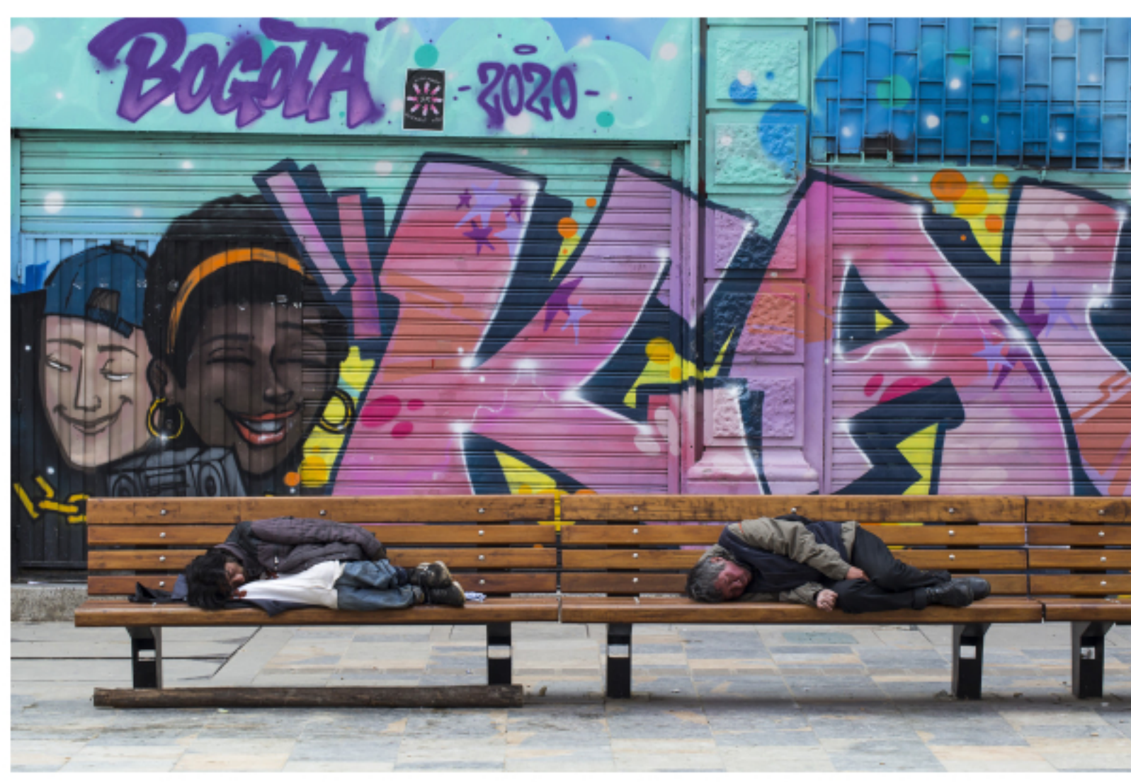
Personas que duermen en bancos en Bogotá, Colombia, mientras el resto del país permanece en cuarentena

Las grandes economías, como hemos visto, ya han inyectado alrededor de $ 8 billones para estabilizar sus mercados después de la crisis. Países como Estados Unidos están fuertemente endeudados (alrededor de $ 22.7 billones en este momento) y ahora incurrirán en otros $ 4 billones , pero a largo plazo, se deben este dinero a sí mismos. Eso les facilita la tarea, a diferencia de las economías emergentes que deben sus deudas a las grandes economías. En términos simples, Colombia , por ejemplo, pide prestado para poner un techo y drenaje en su casa, mientras que Estados Unidos pide prestado para remodelar su casa de huéspedes y cambiar los mosaicos en su piscina. Sus presupuestos son sustancialmente diferentes.