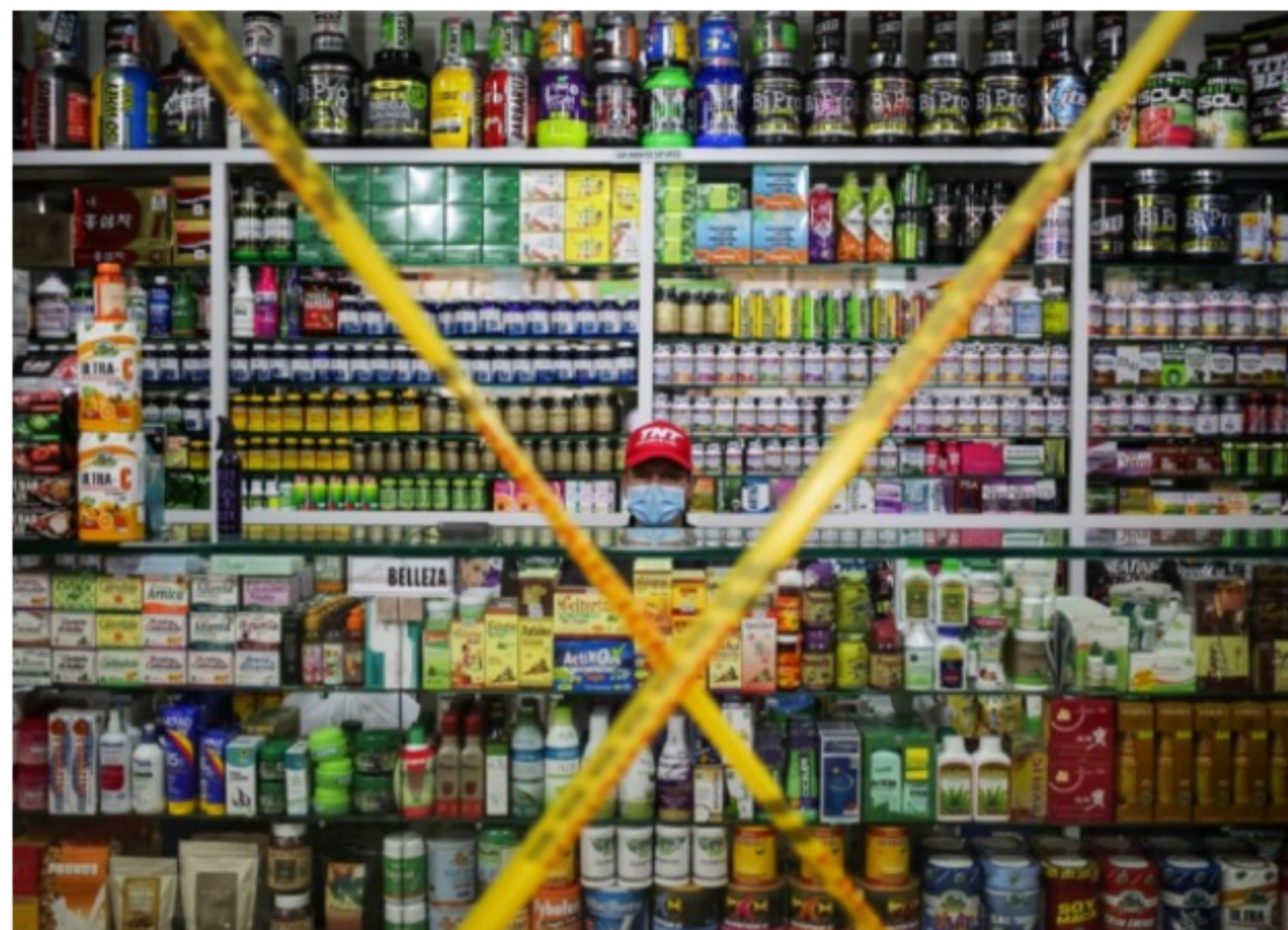
Un vendedor se sienta en una tienda esperando clientes en Bogotá, Colombia.

Colombia es un excelente ejemplo de cómo el gasto excesivo y el endeudamiento dejan poco margen para el error, y por qué es importante adoptar un nuevo enfoque para avanzar.