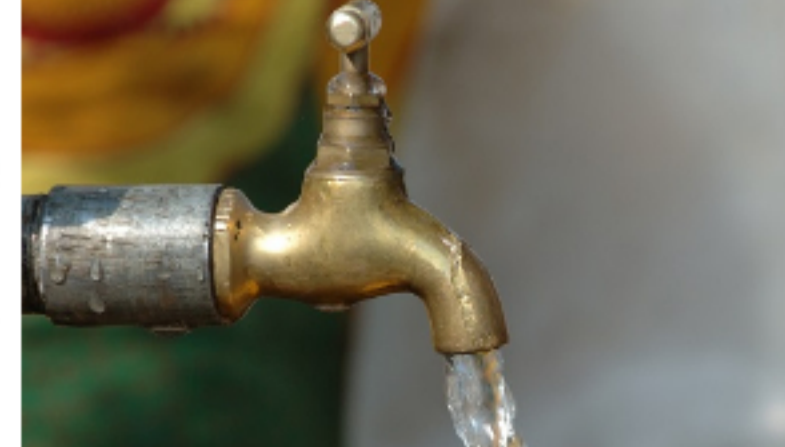
CASANARE / Publicado hace 7 horas Yopaleños denuncian altos costos en la factura de acueducto