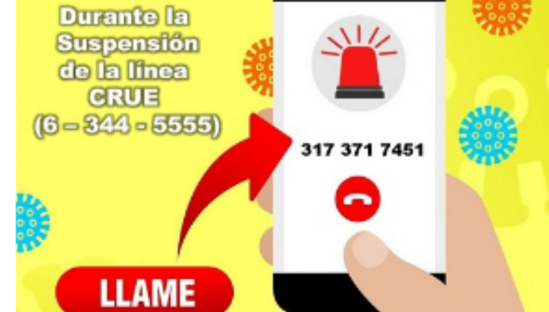
CASANARE / Publicado hace 22 horas Línea de atención de emergencias en Casanare estará fuera de servicio este domingo