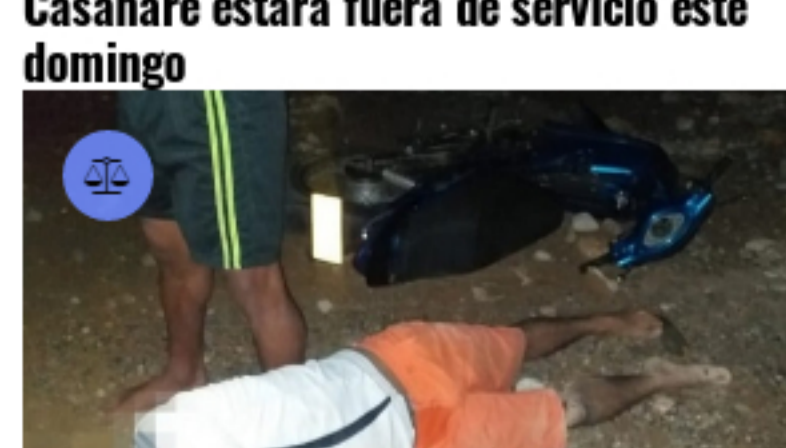
CASANARE / Publicado hace 5 horas Joven mecánico sufrió grave accidente de tránsito en Yopal