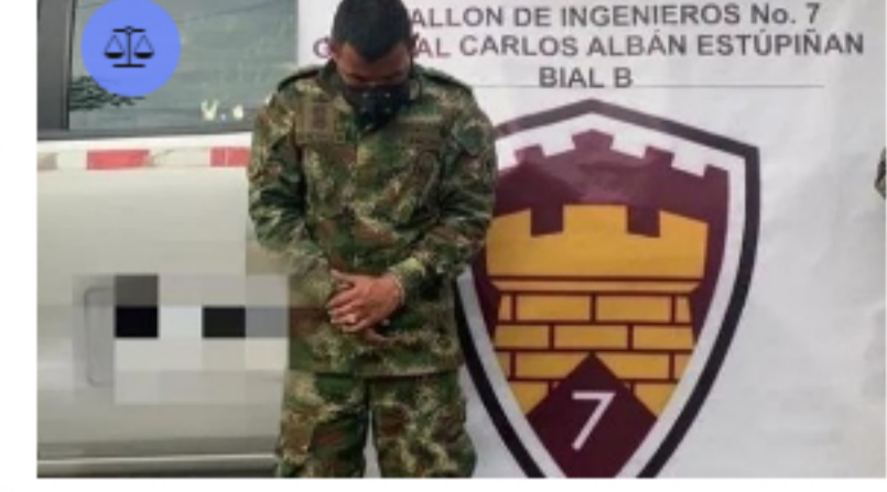
META / Publicado hace 6 horas Sujeito que se hacía pasar como coronel del Ejército fue capturado en Acacias