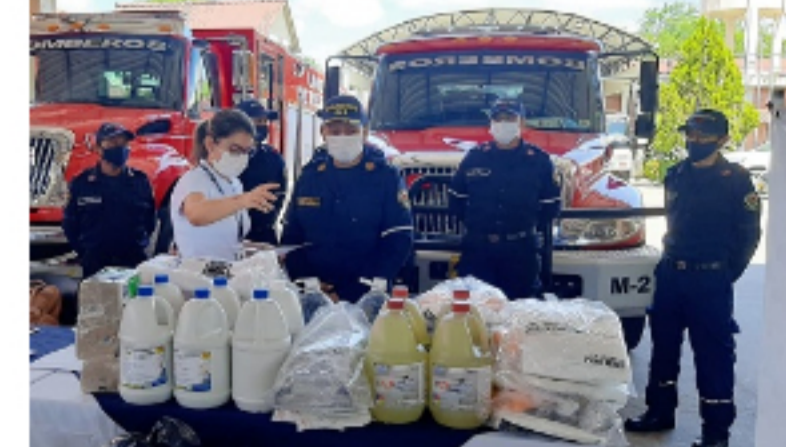
CASANARE / Publicado hace 23 horas Organismos de socorro de Casanare recibieron elementos de protección