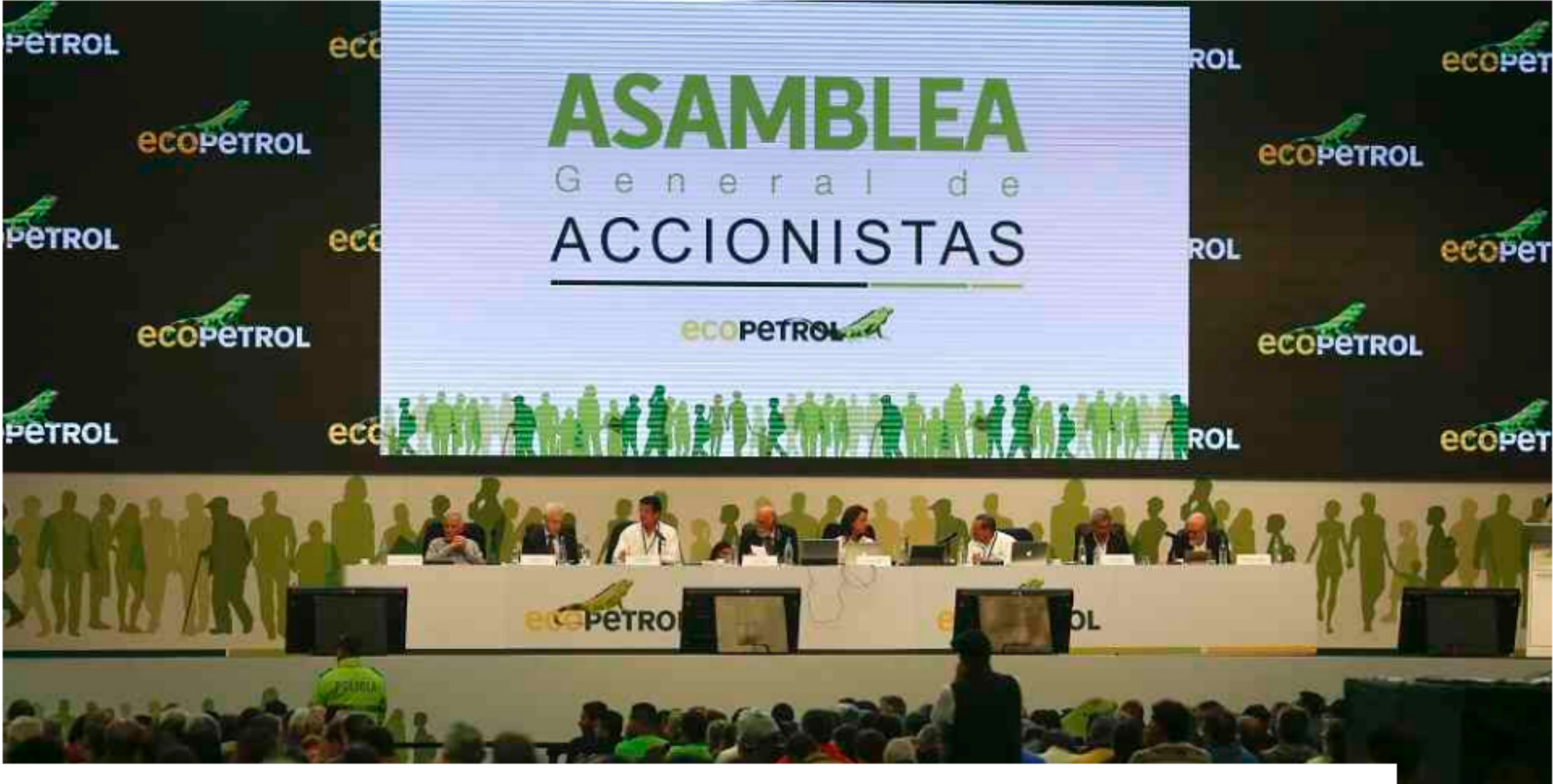
Este es el dividendo que propone Ecopetrol para el 2020

El próximo 27 de marzo la petrolera le propondrá a la asamblea de accionistas un dividendo ordinario de $180.