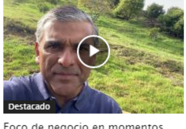
Foco de negocio en momentos especiales en la economía