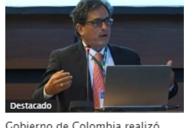
Gobierno de Colombia realizó segundo canje de deuda del año