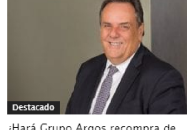
¿Hará Grupo Argos recompra de acciones?