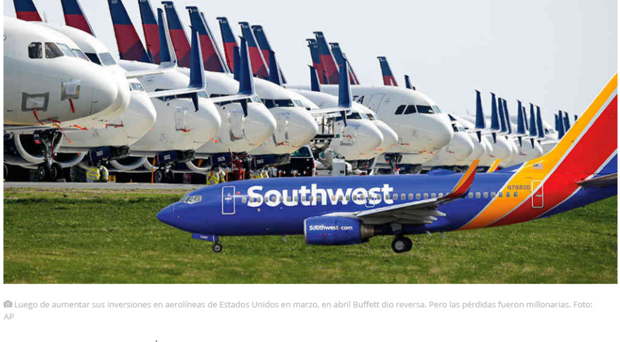
Luego de aumentar sus inversiones en aerolíneas de Estados Unidos en marzo, en abril Buffett dio reversa. Pero las pérdidas fueron millonarias.

El fondo de Warren Buffett es uno de los que más ha perdido en la pandemia: 50.000 millones de dólares. Pero él es ejemplo de que las crisis traen oportunidades. ¿Perdió su toque, se equivocó o se saldrá con la suya?