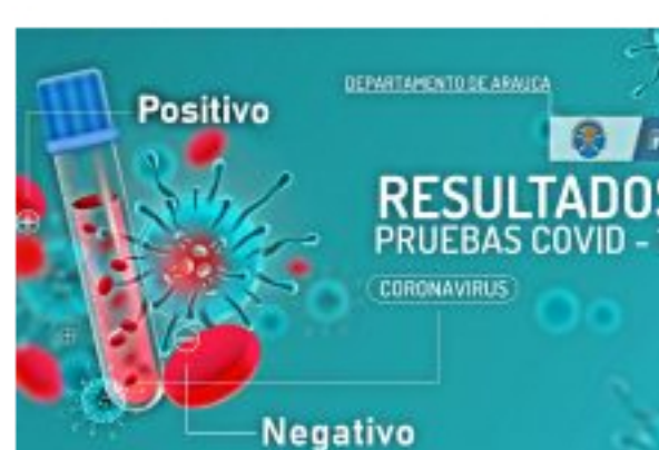
La Unidad Administrativa Especial de Salud Arauca informa: Las 32 muestras para diagnóstico del Coronavirus procesadas salieron negativas