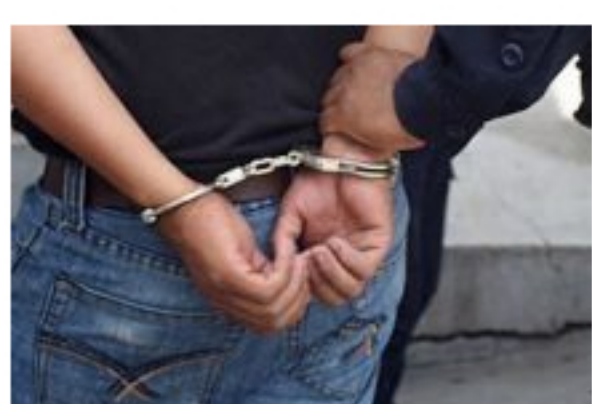
Condenado responsable de delitos sexuales contra una menor en Arauca