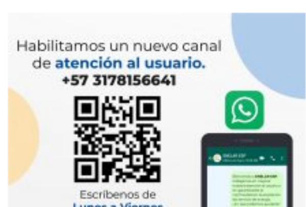
ENELAR ESP amplía sus canales de atención no presenciales habilitando el WhatsApp empresarial 3178156641