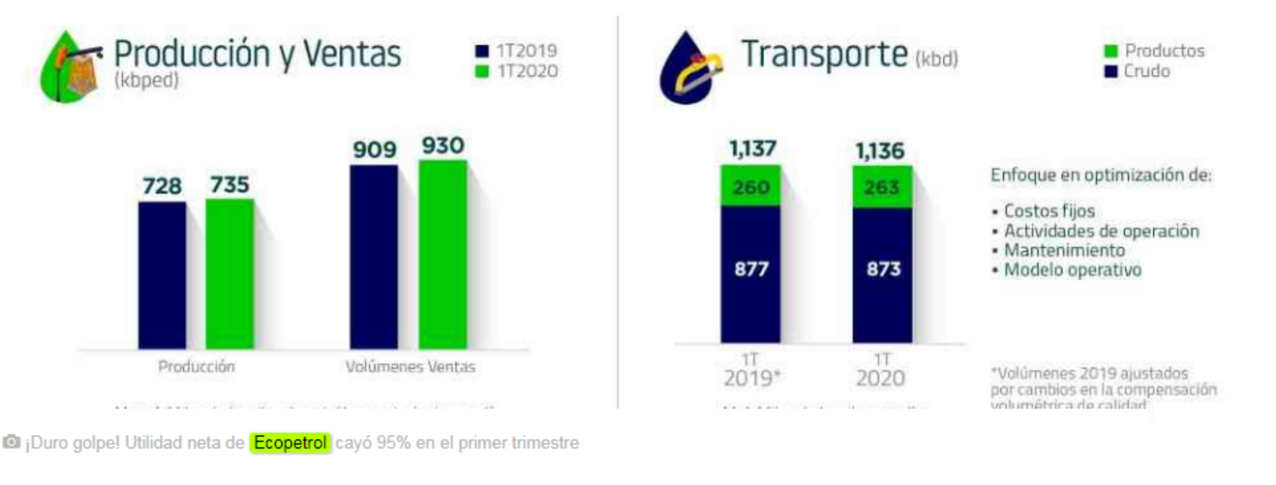
¡Duro golpe! Utilidad neta de Ecopetrol cayó 95% en el primer trimestre

El doble choque de la pandemia del coronavirus y el desplome de los precios del petróleo le pasaron factura a Ecopetrol, que reportó una dura caída de 95,2% de su utilidad neta en el primer trimestre del año.