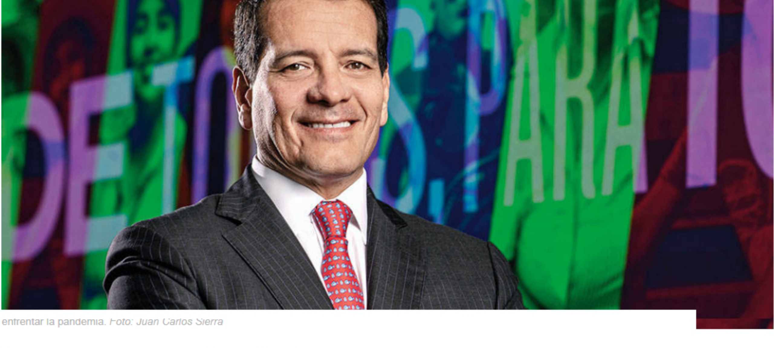
entrentar la pandemia.

El fuerte desplome de 95,2% en las utilidades de Ecopetrol – ante la caída de los precios internacionales del petróleo y la demanda mundial por cuenta de la expansión del coronavirus – es una pésima noticia.