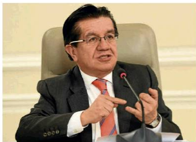
Ministerio de Salud

El ministro de Salud , Fernando Ruiz , hizo un llamado a los centros de comercio electrónico, como call center, centros de procesamiento de datos, y los domiciliarios, a cumplir con los protocolos dispuestos en la Resolución 735 de la misma cartera. La guía señala que se debe disponer de un dispensador de alcohol glicerinado por cada 25 empleados y en cada turno se deben limpiar los equipos (AL)