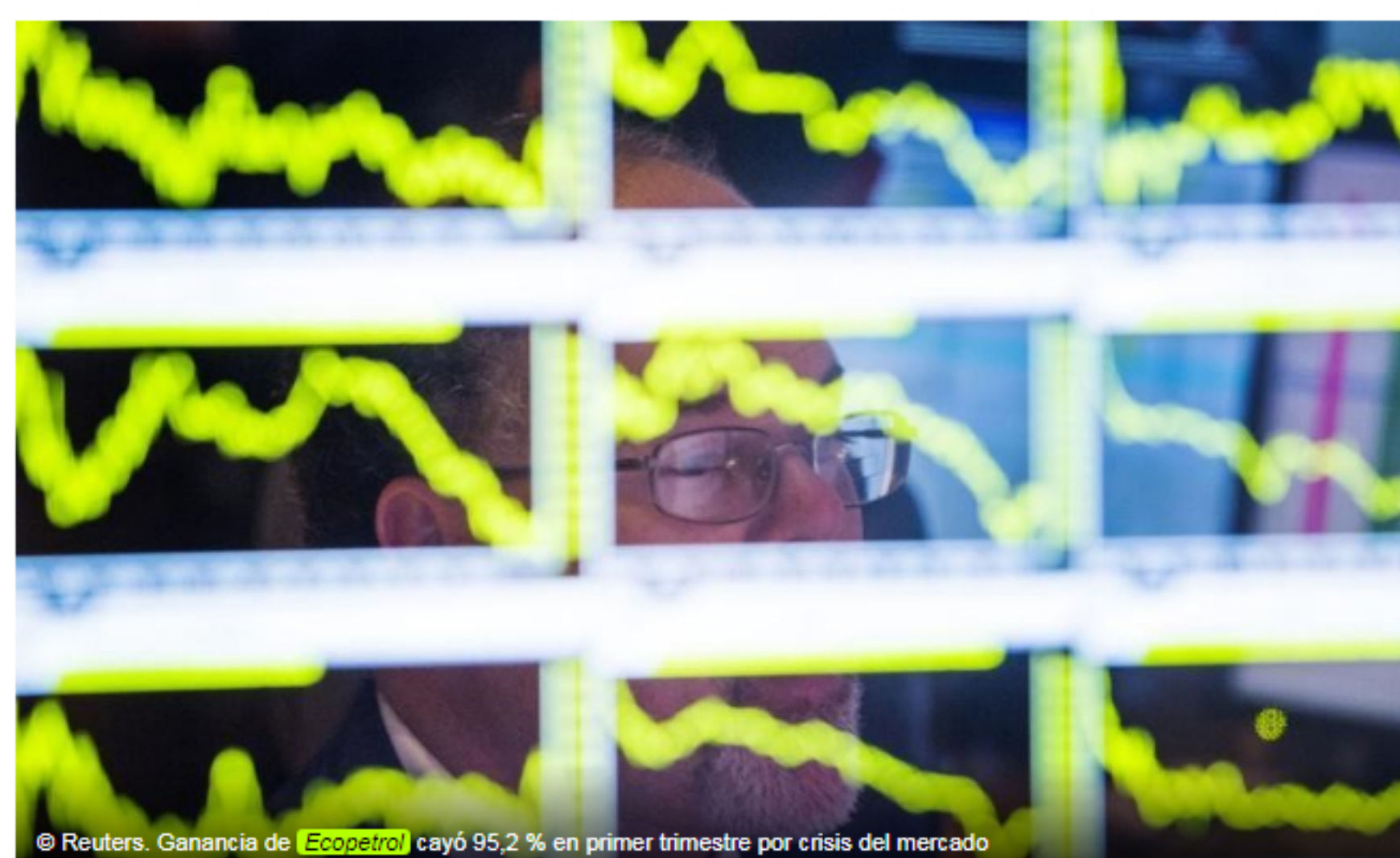
Ganancia de Ecopetrol cayó 95,2 % en primer trimestre por crisis del mercado

Bogotá, 11 may (.).- La petrolera estatal colombiana Ecopetrol (CN:ECO) tuvo un beneficio neto de 133.000 millones de pesos (unos 34,2 millones de dólares) en el primer trimestre del año, marcado por la crisis del mercado mundial del crudo y la pandemia del coronavirus, dijo este lunes el presidente de la compañía, Felipe Bayón.