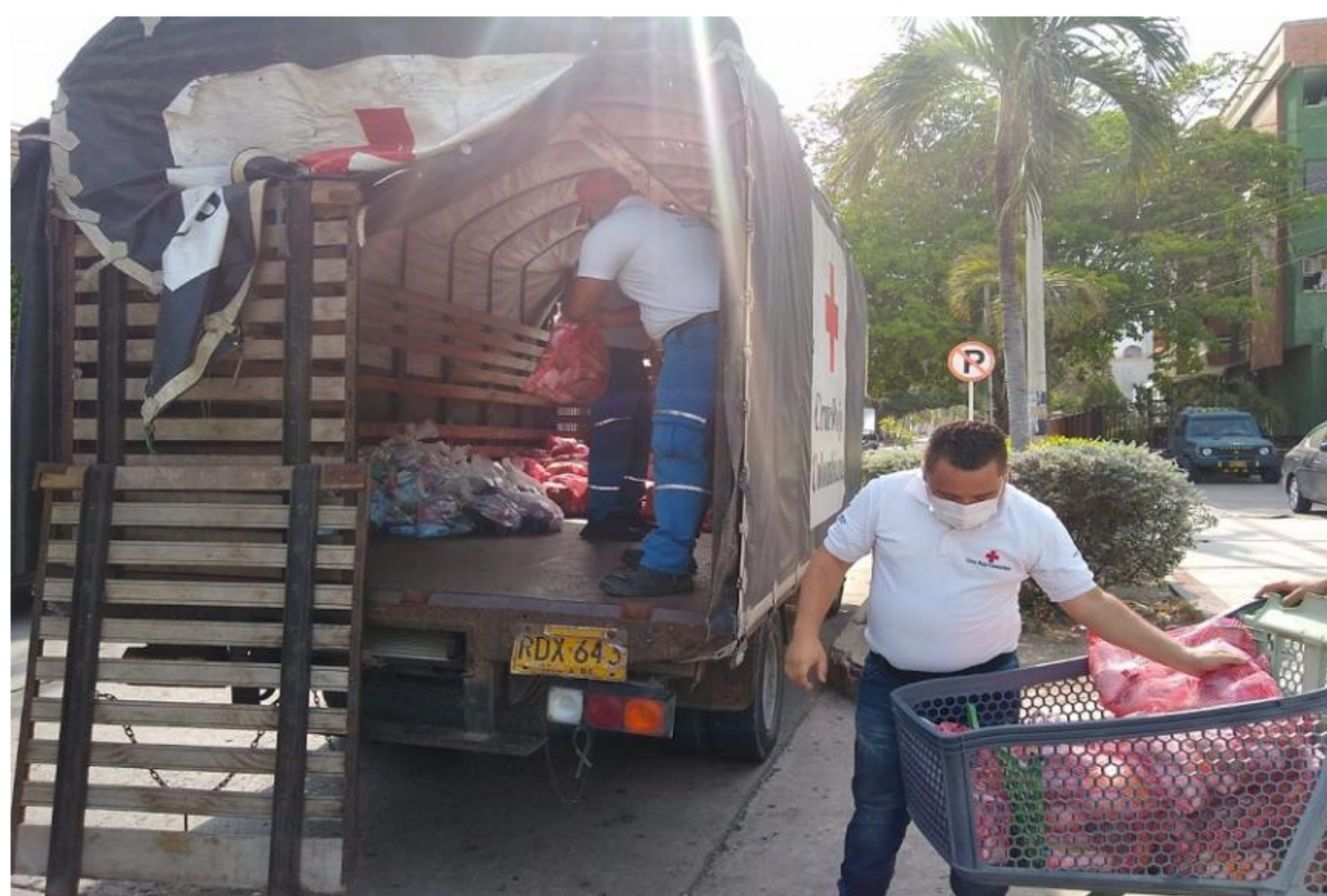
La Cruz Roja organiza la entrega de los mercados.