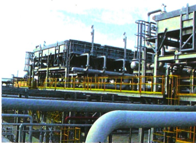
Los campos de gas en La Guajira ahora los controla Ecopetrol.

Entre tanto, la firma Eurocerámica, productora de materiales para construcción, fue enajenada al grupo mexicano Lamosa, mientras que el 50 por ciento Occidental de Empaques pasó de manos del Grupo Argos y