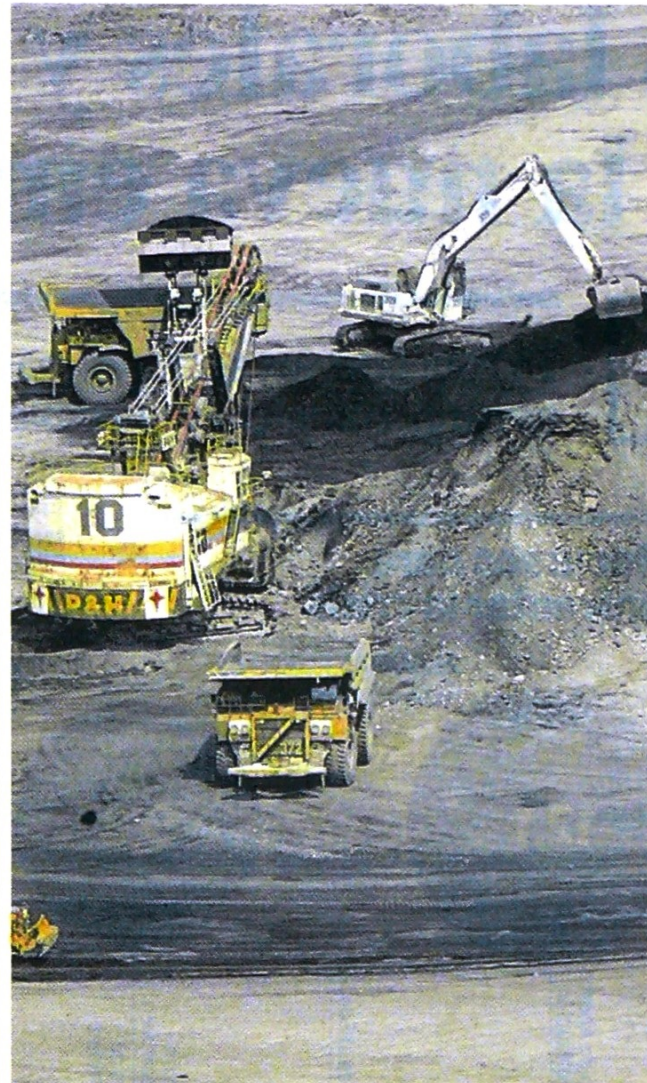
El Cerrejón reactivó su operación el pasado 4 de mayo.

En el mismo sentido, un proyecto minero cuya operación es la primera a gran escala en producción industrial de oro del país y que iniciaría operación en los próximos meses, y que ya tienen listos los protocolos de seguridad sincronizados con la operación es el complejo Buriticá en el departamento de